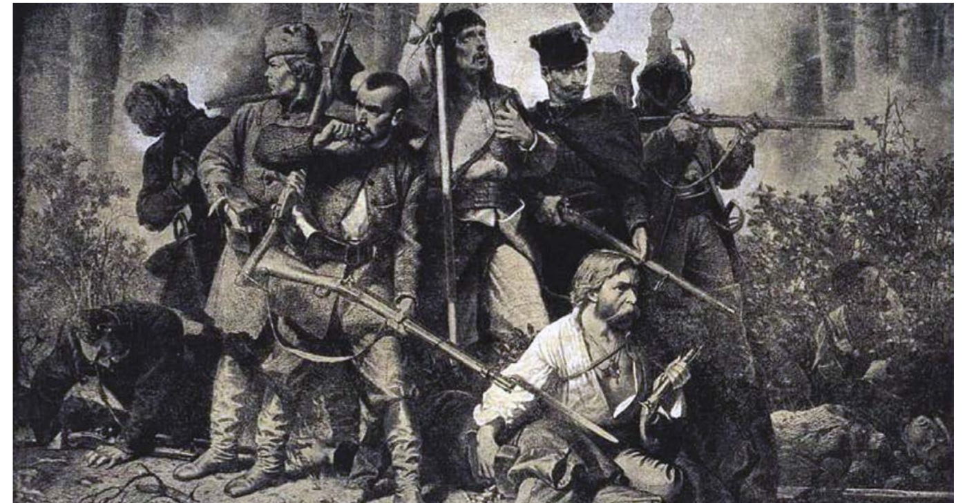
"Bitwa", obraz z cyklu "Polonia" Artura Grottgera (domena publiczna)

W 2024 r. obchodzimy 160. rocznicę upadku powstania styczniowego. Klęska tego zrywu wolnościowego była tragicznym wydarzeniem, ale powstanie odegrało ważną rolę w dziejach naszej Ojczyzny.