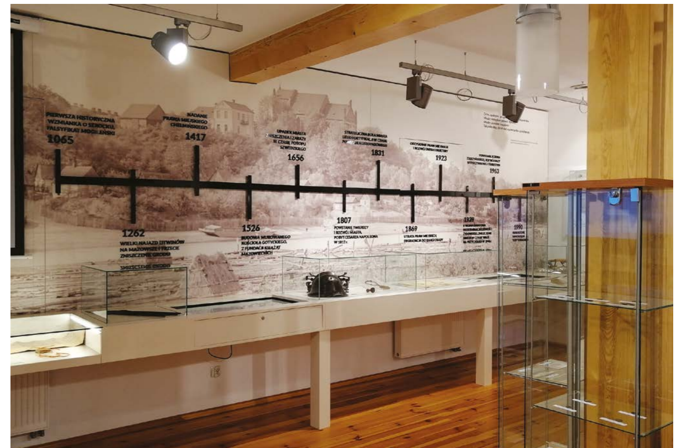
Linia czasu prezentująca najważniejsze wydarzenia z historii miasta i gminy. Poniżej gabloty z eksponatami.