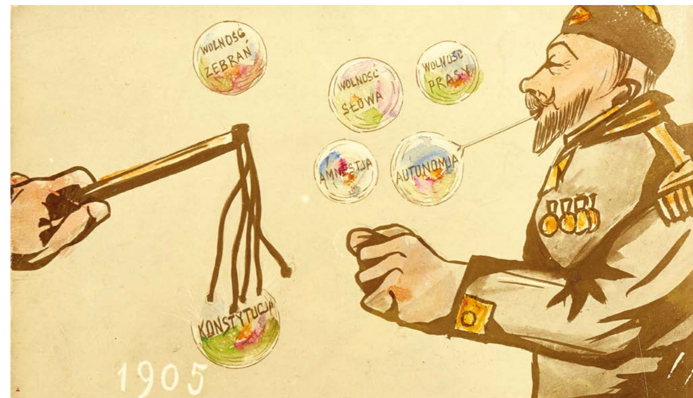
Pocztówka z okresu rewolucji 1905 r.