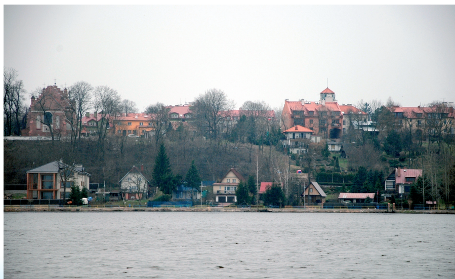
Widok na Serock z wałów na Cuplu