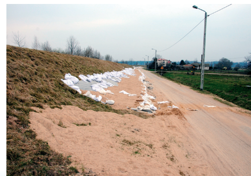
Umocnienie wałów przeciwpowodziowych 2011 r.

Miejscowość narażona stale na powodzie i potopienia nigdy nie miała zbyt wielu stałych mieszkańców. Część łąk na jej terenie należała do gospodarzy z sąsiednich wsi Łachy i Nowej Wsi, które na początku XIX wieku były na nowo zagospodarowane przez niemieckich kolonistów wyznania ewangelicko-augsburskiego. W zapisach ar-