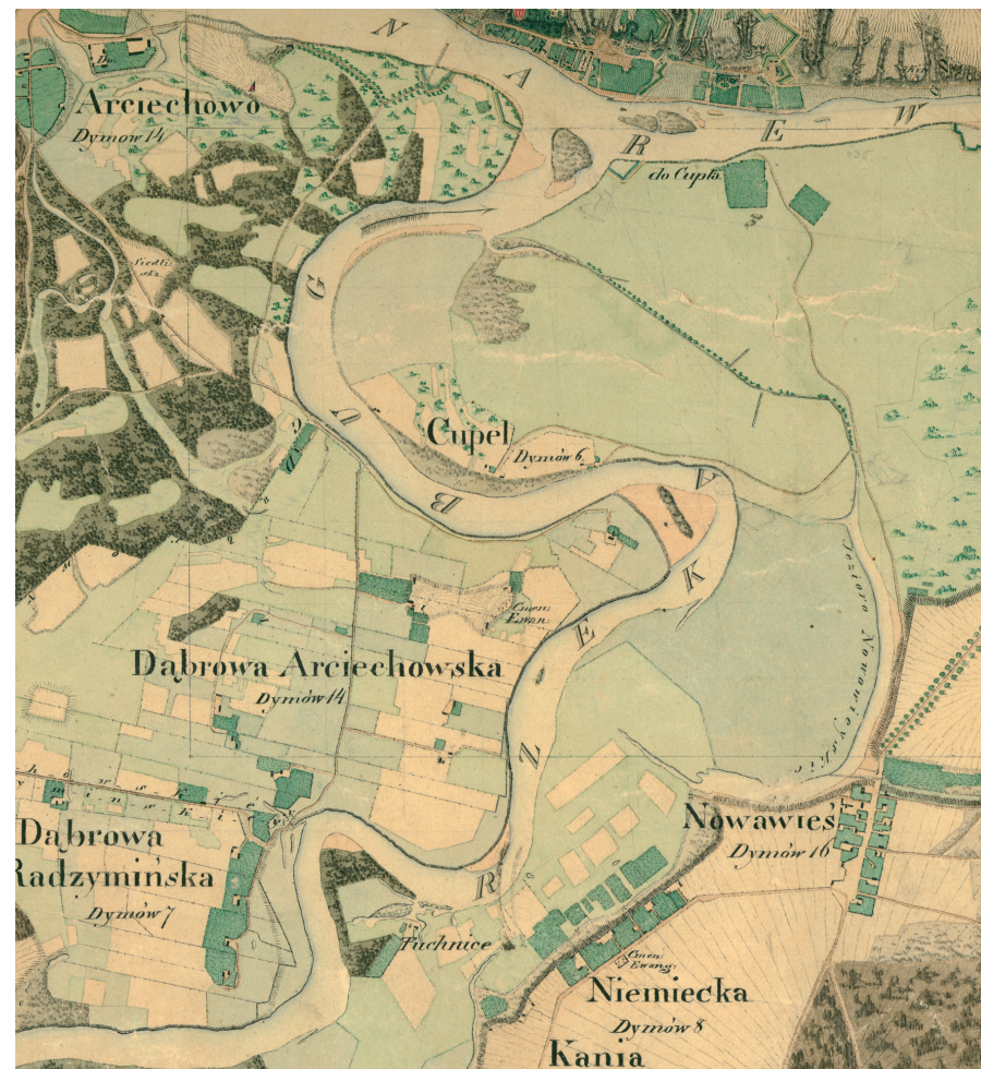
Cupel na mapie z I połowy XIX w.

W trakcie budowy twierdzy napoleońskiej w Serocku, w latach 1807-1810, powstała na Cuplu niewielkie umocnienie ziemne, swego rodzaju przedmoście. Widać je zarówno na mapie z 1824 r., jak i na niemieckiej mapie z 1916 r. pod nazwą Alte Schanze . Z budową tych umocnień można wiązać etymologię nazwy Budy Skrzyńki, gdyż technologia budowy wałów opierała się na drewnianym szkieletie mającym formę wielkich skrzyń.