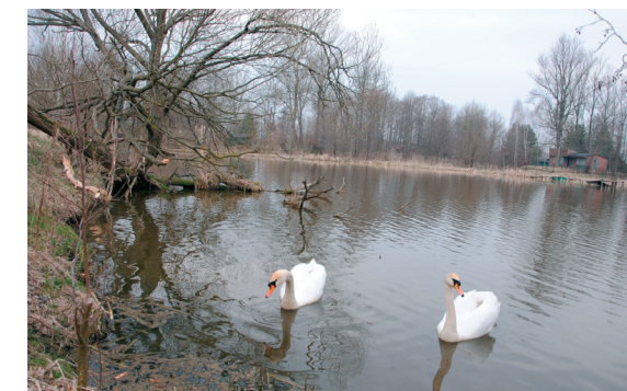
Łabędzie pływające w starym korycie Bugu