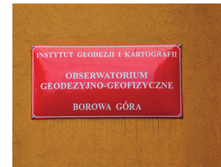
Tablica na budynku Obserwatorium