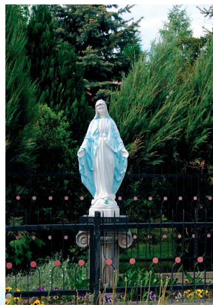
Figura przy ulicy Lipowej