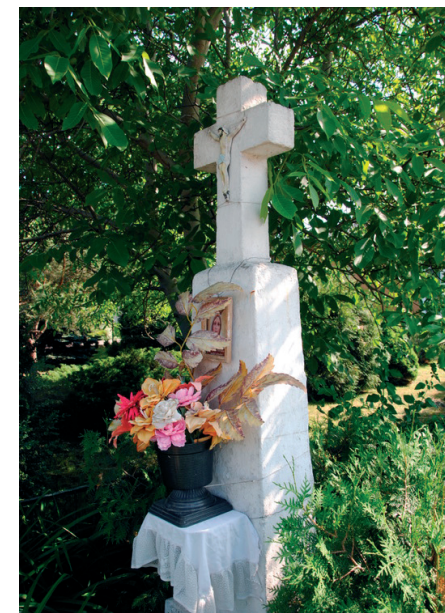
Kapliczka przy ulicy Nasielskiej