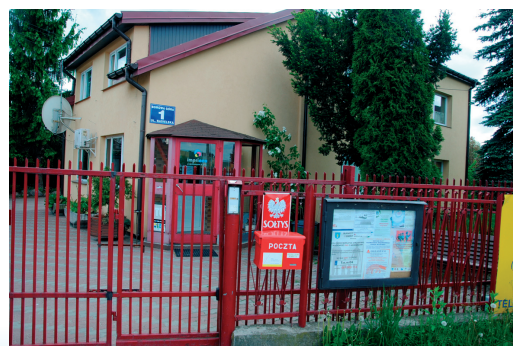
Trzy w jednym - sklep-poczta - dom Pani sołtys