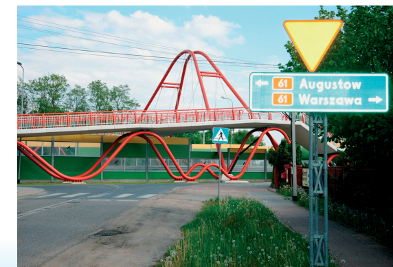
Kolorowe wiadukty na drodze 61