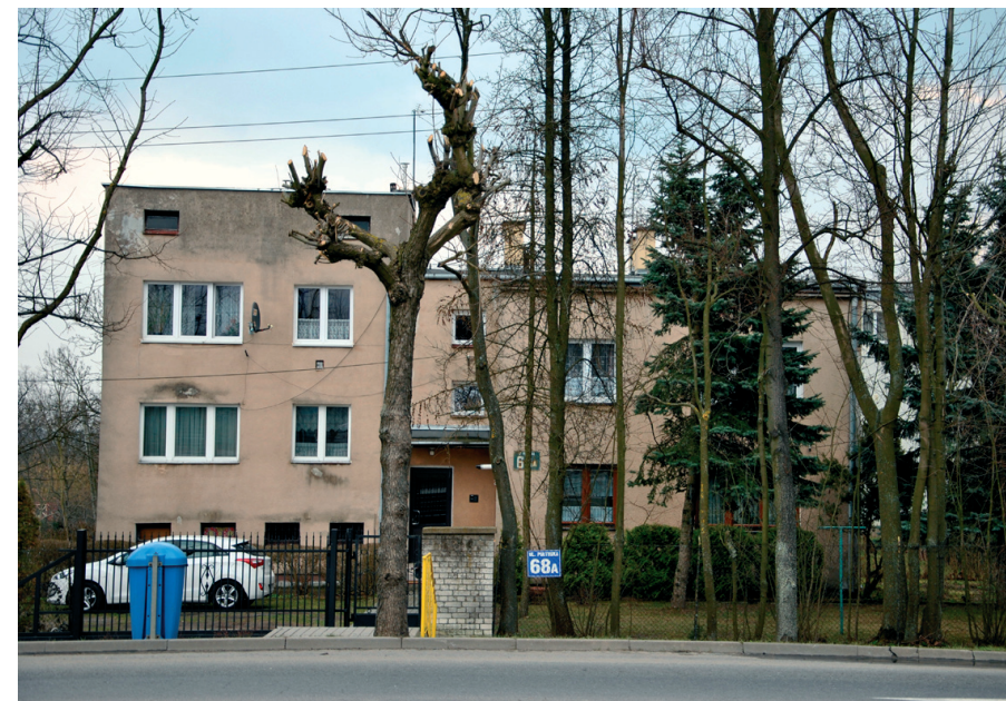
Dom nauczyciela w sąsiedztwie krzyża