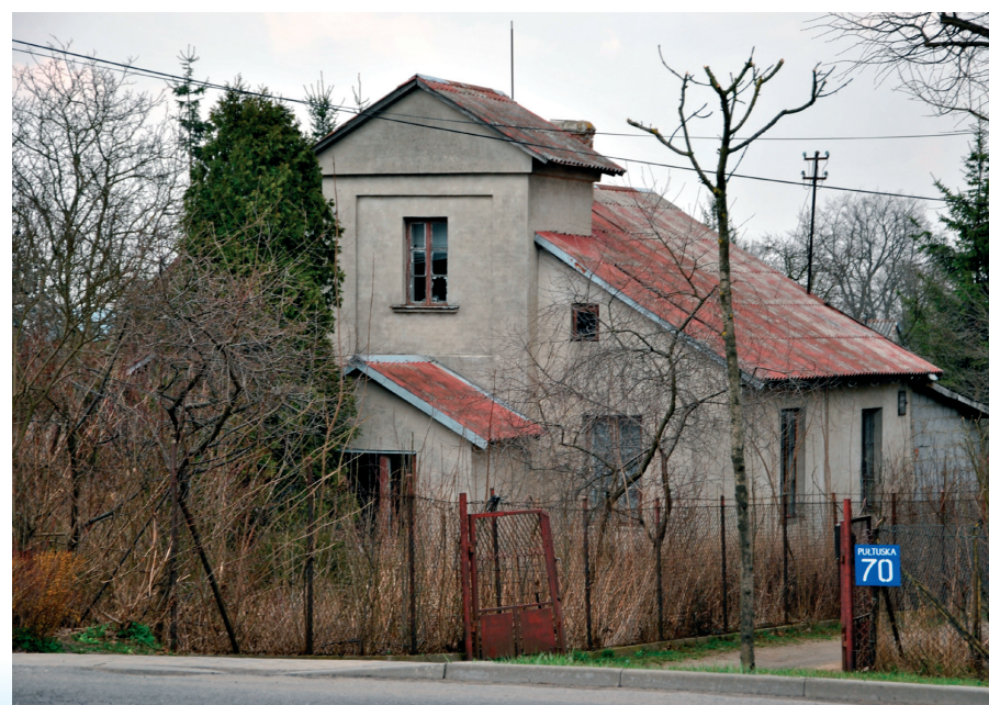
Stary dom w sąsiedztwie krzyża