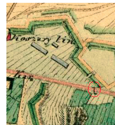
Serock 1828 r. - fragment mapy