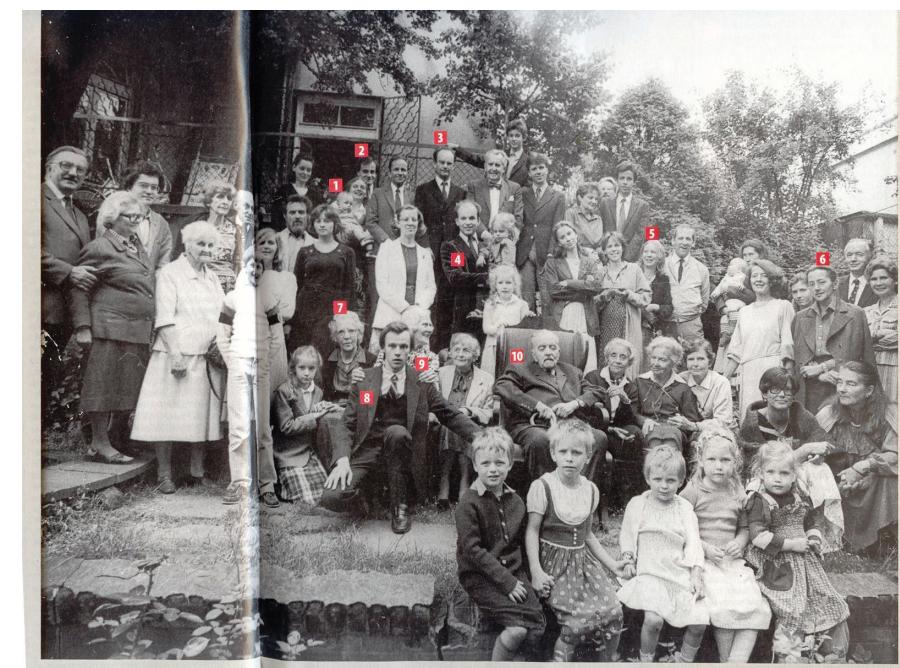
Radziwiłłowie (nr 4 Konstanty Radziwiłł - Minister Zdrowia, nr 6 Anna Radziwiłł - wiceminister edukacji w rządzie Tadeusza Mazowieckiego)