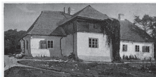
Dwór w Pobyłkowie