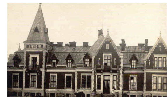
Pałac w Jadwisinie - pocztówka

W 1893 r. jako jeden z pierwszych pośpieszył na ratunek płonącemu Serockowi, a w okresie walki o język polskich w szkole i urzędach wspierał protestujących nie tylko swoją obecnością.