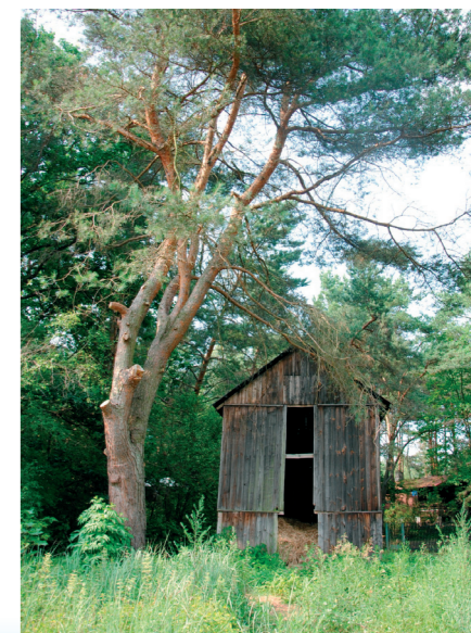
Stara wiata na siano w gospodarstwie pana Łapińskiego