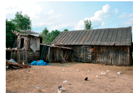
Stara stodoła i gołębnik pp Pawlaków przy ul. Nadbużańskiej