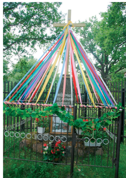
Kapliczka z 1889 r.