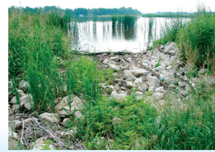
Umocnienia brzegu Bugu