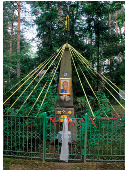
Kapliczka przy ulicy Popowskiej z 1914 r.