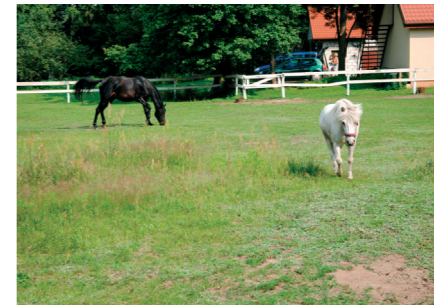
Konie są pasją jednego z mieszkańców

letniego wypoczynku i już w 1963 r. Zjednoczone Zespoły Gospodarcze „Inco”, należące do Stowarzyszenia PAX, uzyskały od Prezydium Wojewódzkiej Rady Narodowej decyzję o szczegółowej lokalizacji budowy ośrodka kolonijnego w Bindudze, którą rozpoczęto dwa lata później.