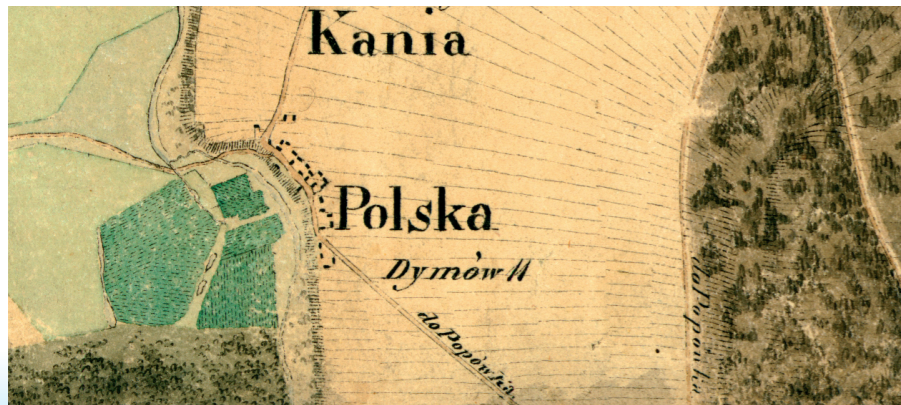
Kania Polska na mapie z I poł. XIX w.