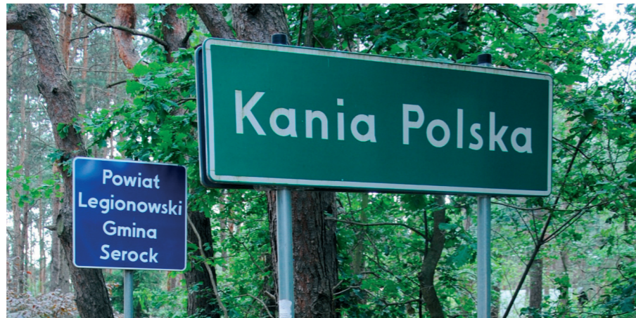
Granica wsi, gminy i powiatu