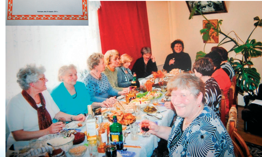
Spotkanie Koła Gospodyń