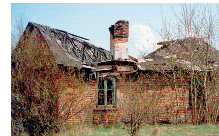
Zrzucony dom, stan z 2005 r.