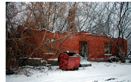
Szkielet starego domu