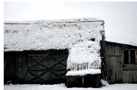
Stodoła pp. Nałęczów

zasięg może być porównywany z obecnym obwodem szkoły w Woli Kiełpińskiej, która zresztą w 1945 r. zajęła jej miejsce i jest kontynuatką jej tradycji.