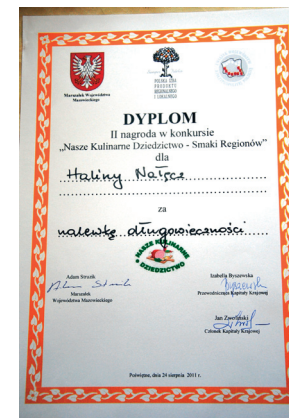
Dyplom Pani Nałęcz