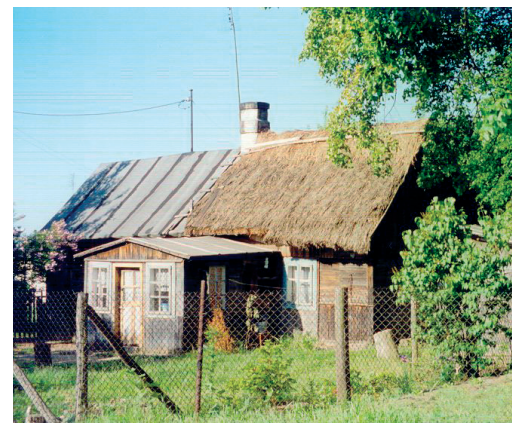
Drewniany dom pod nr 40