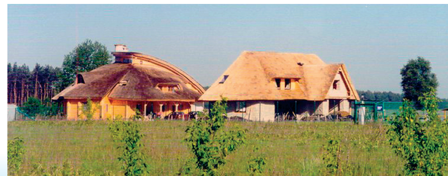
Nowe domy w starym stylu projektu arch. Andrzeja Olbrysa