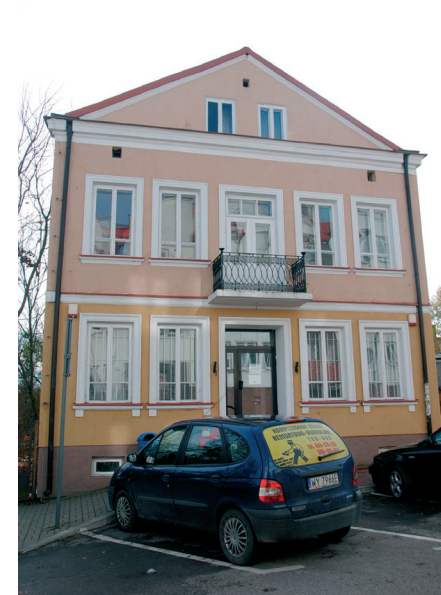
Budynek dawnej poczty 2013 r.