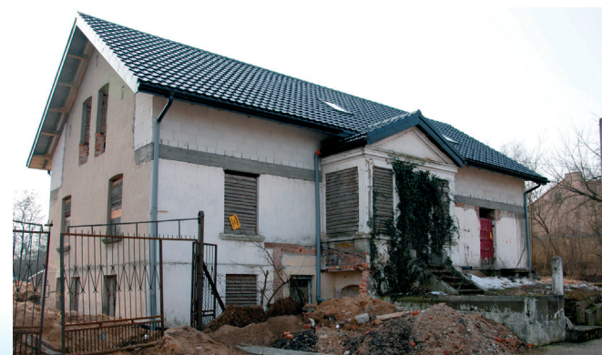
Budynek dawnej apteki luty 2015