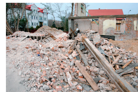
Remont budynku dawnej apteki