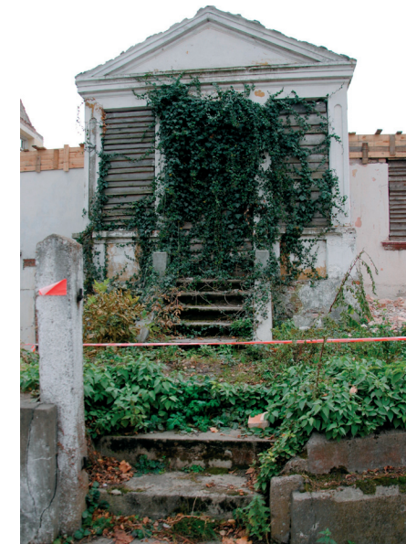
Schody do dawnej apteki