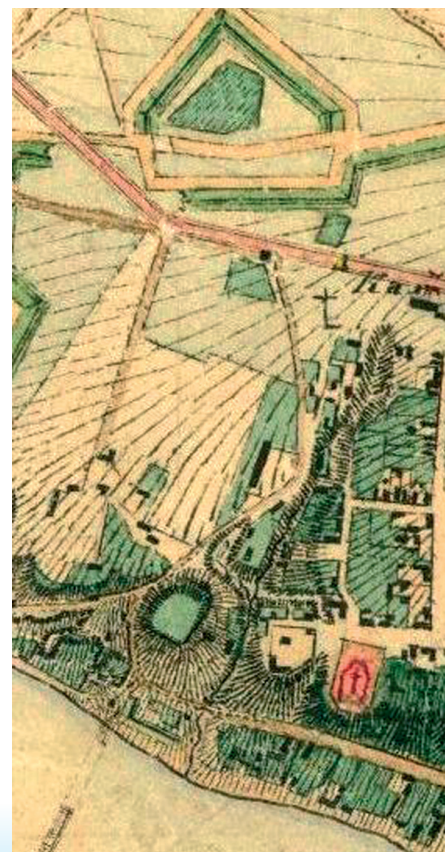
Ulica na planie z ok. 1825 r.