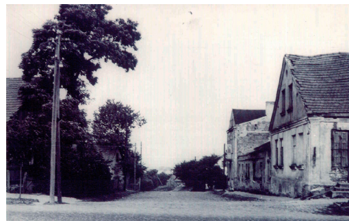
Ul. Radzyмиńska ok. 1958 r.