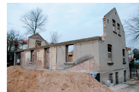
Budynek dawnej apteki od strony ogrodu