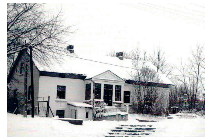
Budynek dawnej apteki w 2001 r.