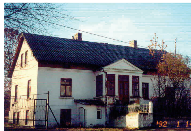
Budynek dawnej apteki pod koniec XX w.