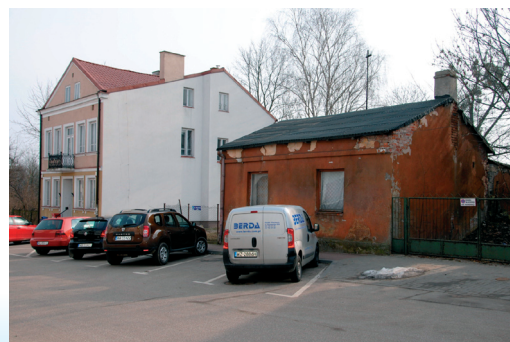
Ul. Radzyмиńska luty 2015 r.