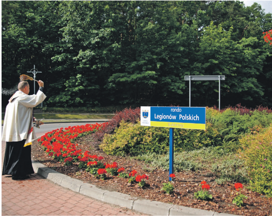
Nadanie imienia rondo Legionów Polskich w Białobrzegach, czerwiec 2017 r.

Choć w kontekście historii naszej gminy obecność królów z dynastii Wazów w Nieporęciu była jedynie epizodem, to na