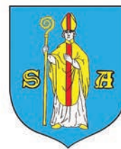
Miasto i Gmina Serock