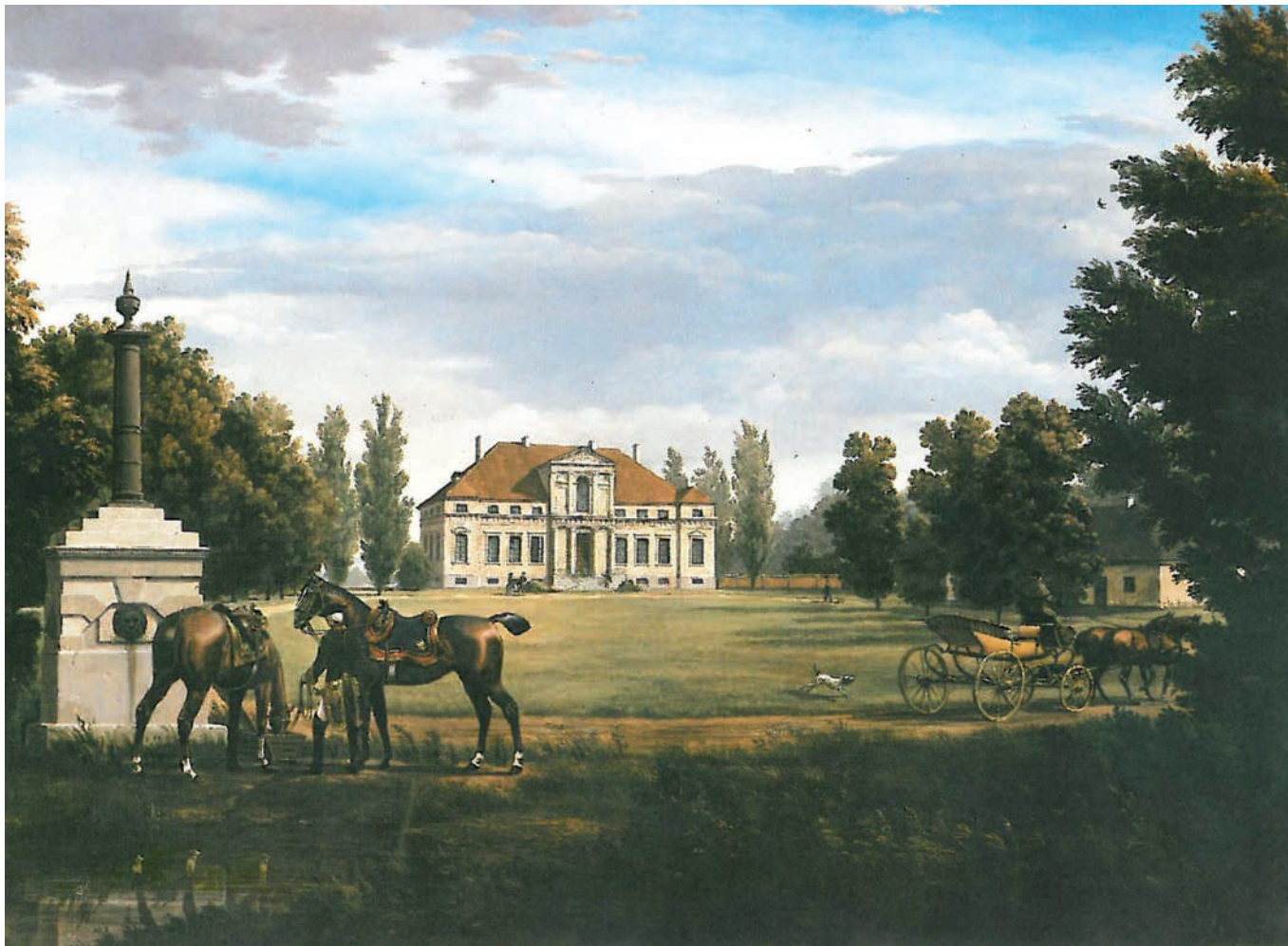
Fasada ogrodowa klasycystycznego pałacu w Górze (autor Andrzej Novák-Zempliński)

Klasycystyczny pałac w Górze został zbudowany około 1780 roku, z inicjatywy i fundacji ówczesnego właściciela dóbr nowodworskich i górskich - księcia Stanisława Poniatowskiego (1754-1833), bratanka króla Stanisława Augusta Poniatowskiego.