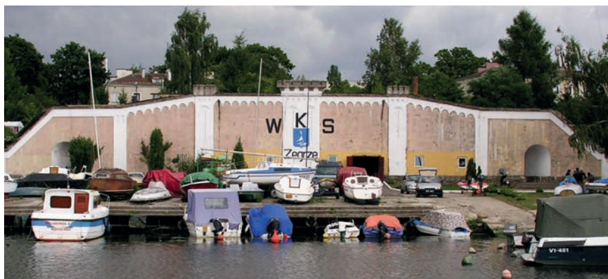
Prochownia zachodnia nad Narwią w Zegrzu