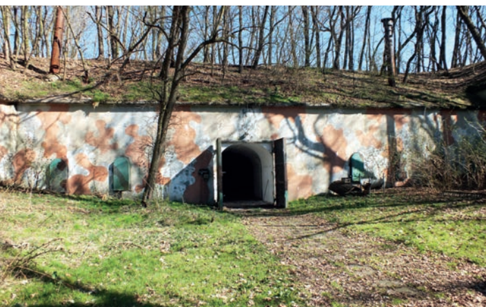
Koszary szyjowe zegrzyńskiego Umocnienia Małego

poprzecinaną wązozami. Twierdzy, mającej powstać na terenie nizinnym, nadał charakter fortyfikacji górskiej.