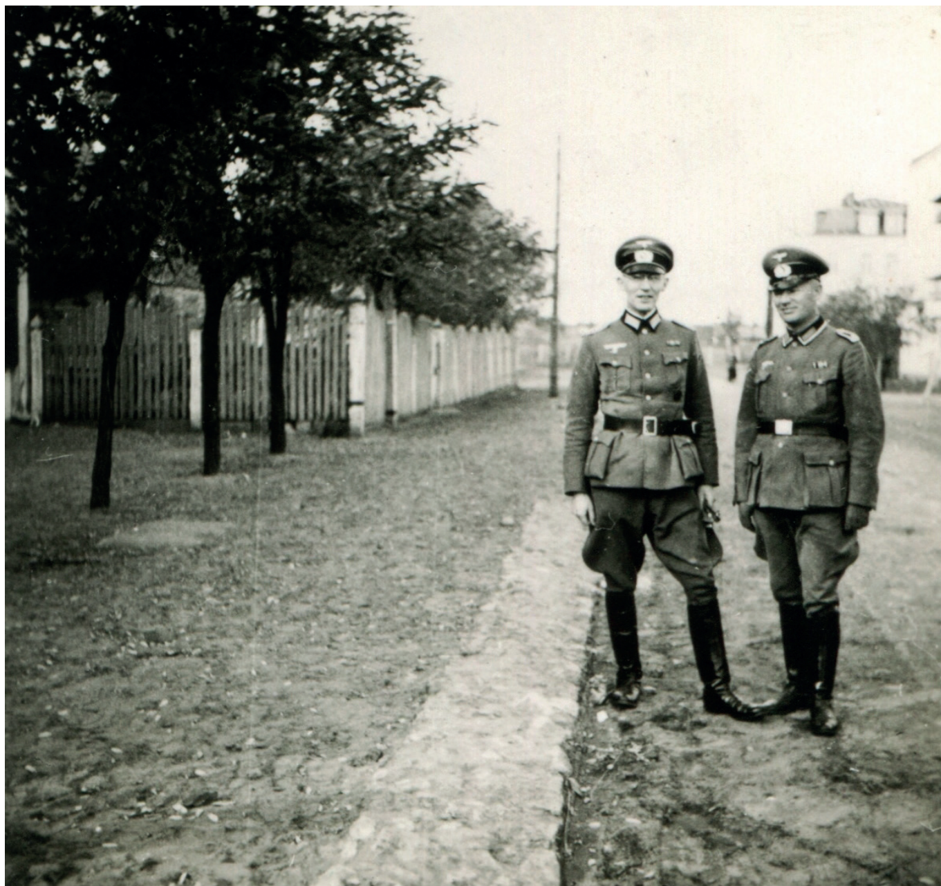
Niemieccy okupanci na ul. Kopernika, Legionowo, październik 1939 r.