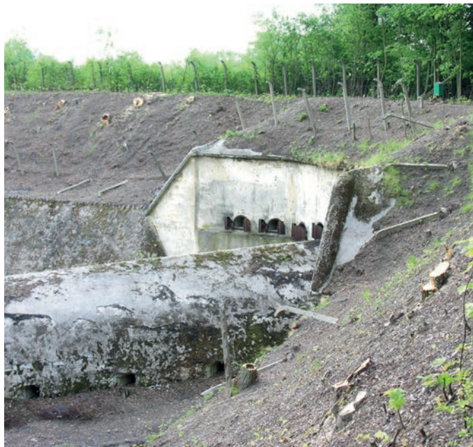
Kaponiera grodzowo-przeciwskarpowa w fosie Umocnienia Dużego w Zegrzu