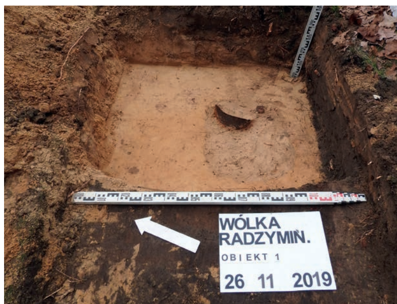
Mogiła przy pomniku Strzelców Kaniowskich w trakcie ekshumacji