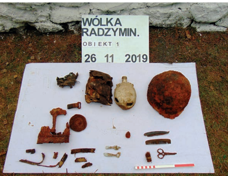
Odkryte elementy wyposażenia wojskowego

wadzone przez wybraną przez IPN firmę archeologiczną odbyły się bardzo szybko, bo już 26 listopada 2019 r. Uczestniczyli w nich także przedstawiciele Polskiego Czerwonego Krzyża, Ambasady Federacji Rosyjskiej oraz członkowie stowarzyszenia. Już po zdjęciu ok. 20 cm warstwy humusu w planie wykopu widoczny był prostokątny zarys niewielkiej jamy grobowej. W toku dalszej eksploracji odsłonięto i zadokumentowano przemieszane szczątki oraz elementy wyposażenia. Co ciekawe znalezione przedmioty pokrywały się z listą zamieszczoną w notatce. Dodatkowo odkryto też relikty menażki oraz niemiecką (zdobyczną) manierkę. Nie udało się niestety natrafić na wskazówki, które pozwoliłyby zidentyfikować pochowanego. Prawdopodobnie było to jeszcze możliwe w chwili pierwszego wydobycia szczątków, kiedy znaleziono dokumenty poległego.