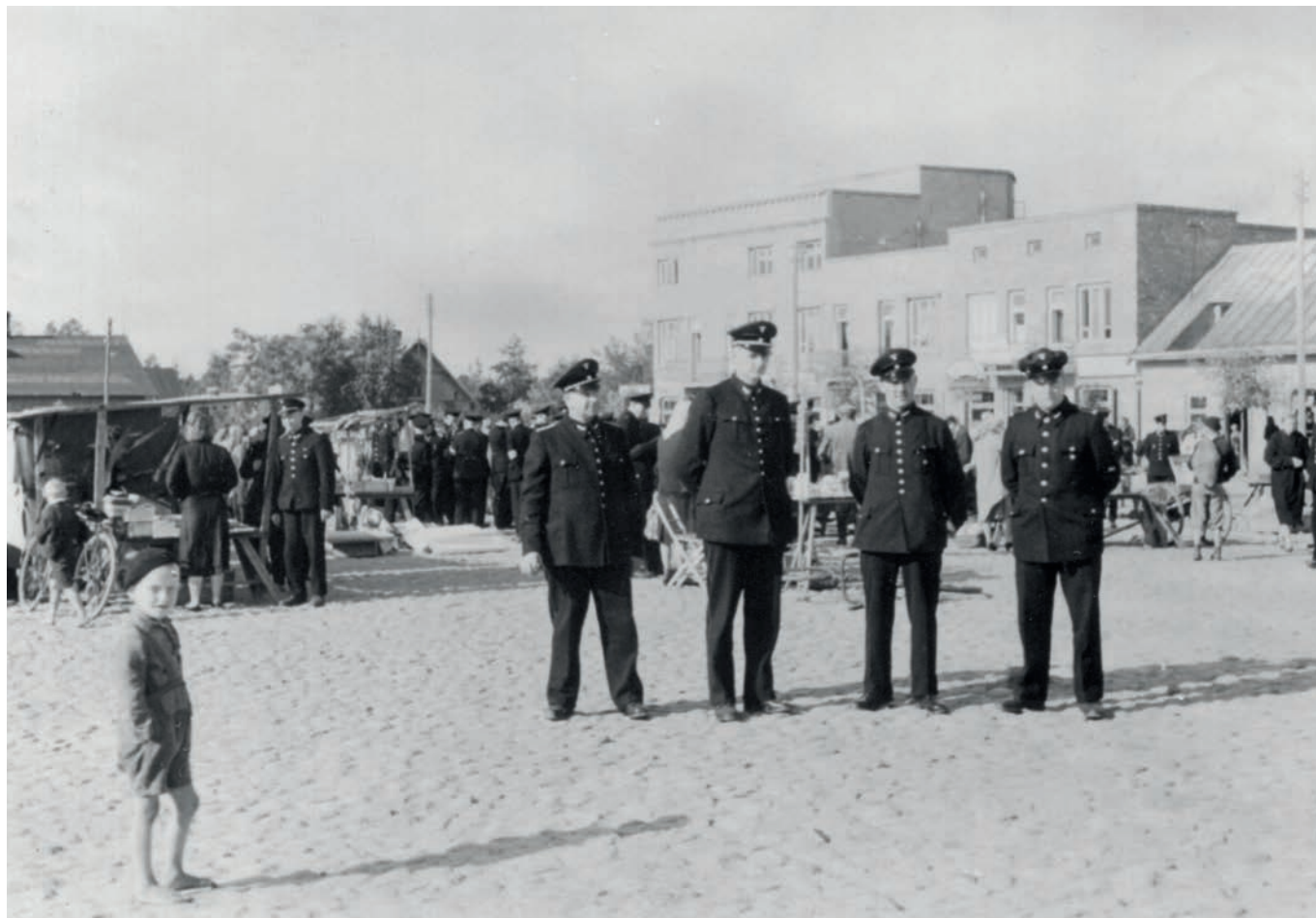
Niemieccy kolejarze na tle narożnej kamienicy przy ul. Batorego 12 (dziś nr 10), ok. 1941 r.