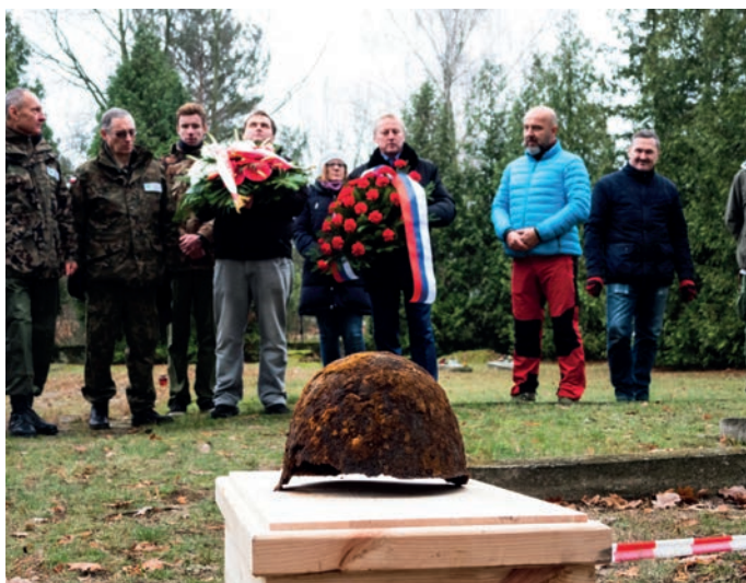
Pochówek na cmentarzu wojennym w Białobrzegach