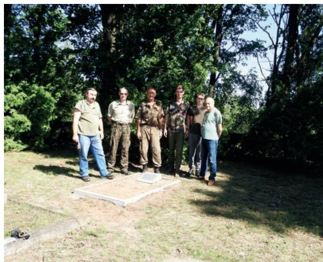
Uporządkowana mogiła

Niestety przy ponownej ekshumacji nie było ich już.