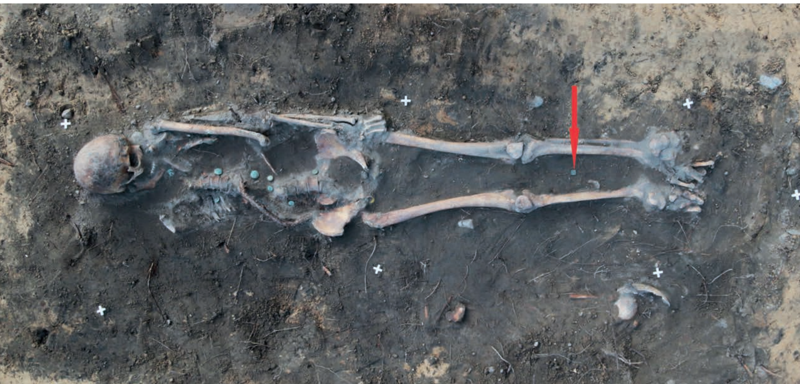
Grób mężczyzny z oznaczonym miejscem odnalezienia odważnika