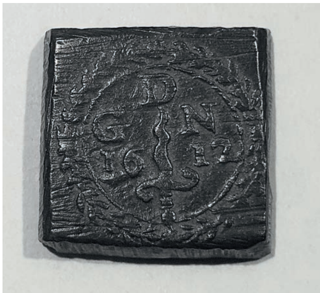
Odważnik monetarny z Zegrza (Muzeum Historyczne w Legionowie)

gielskich, złotych monet, tzw. nobli. Monety te zaczęto wybijać ok. połowy XIV w. i wartością przewyższały floreny. Bito je w różnych wersjach do pierwszej połowy XVII w. Na awersie wybite było przedstawienie półpostaci króla z mieczem i tarczą, wyobrażonego w okręcie na wzburzonym morzu, co symbolicznie miało podkreślać rosnącą potęgę morską Anglii. Znane są również no-