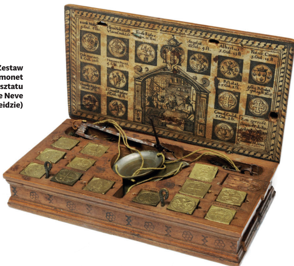
Zestaw do ważenia monet z warsztatu Guillema de Neve (Muzeum Lakenhal w Leidzie)

Zaskoczeniem było to, do odważania jakich monet służył nasz ciężarek. Z dużym prawdopodobieństwem można powiedzieć, że służył do sprawdzania wagi an-