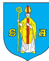
Miasto i Gmina Serock