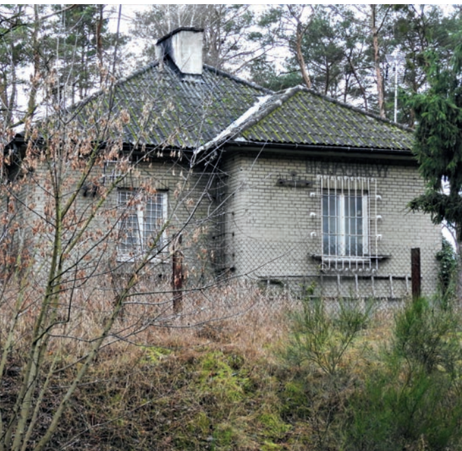
Budynek kolejowy obecnie

wano mieszkańców okolicznych wsi przed wywózką do łagrów w ZSRR. Być może to właśnie stąd wyruszyli oni na nieludzką ziemię.