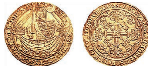
Nobel Ryszarda II z 1377 r.

podarków ulegając tezauryzacji czyli wycofywano je z obiegu gromadząc je jako lokatę kapitału.