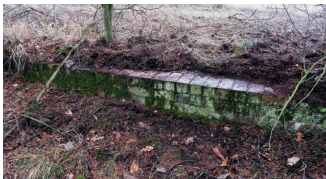
Rampa z klinkieru

Po wojnie stacja wykorzystywana była przez jednostkę wojskową z Białobrzegów. W połowie lat pięćdziesiątych w białobrzegim lesie utworzono 93. Wojskową Składnicę Map. Tajne, podziemne obiekty zlokalizowano na zamkniętym, ogrodzonym podwójnym drutem kolczastym, terenie rozciągniętym od dzisiejszej al. Wojska Polskiego w Białobrzegach do linii kolejowej Legionowo – Tuszcza. Wzmocniła się tym samym pozycja strategiczna stacji. W 1969 r. rozbudowano ją o nową nastawnię przekaźnikową i semaforów świetlnych, a w 1972 r. linia kolejowa i tory stacyjne zostały zelektryfikowane. Transporty (głównie opału) dla jednostki wojskowej odbywały się do końca lat 90. Jednej zimy, żołnierze rozładujący węgiel z wagonów chcieli się ogrzać paląc ognisko. Wykopując pod nie małe wgłębienie w ziemi, natrafili na ludzkie kości. Okazało się, że były to szczątki czterech żołnierzy