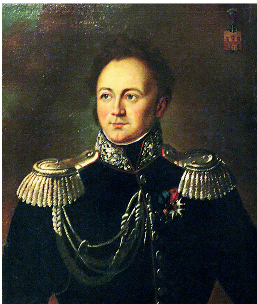
Gen. Ignacy Prądzyński – twórca planu „wyprawy na gwardie”

190 lat temu Serock odegrał ważną rolę w powstaniu listopadowym, a właściwie w jego drugiej części – wojnie polsko-rosyjskiej 1831 roku. W mieście i okolicach zgromadziło się kilkadziesiąt tysięcy polskich żołnierzy, którzy pomaszzerowali pod Ostrołkę, gdzie 26 maja 1831 r. odbyła się wielka bitwa z Rosjanami.