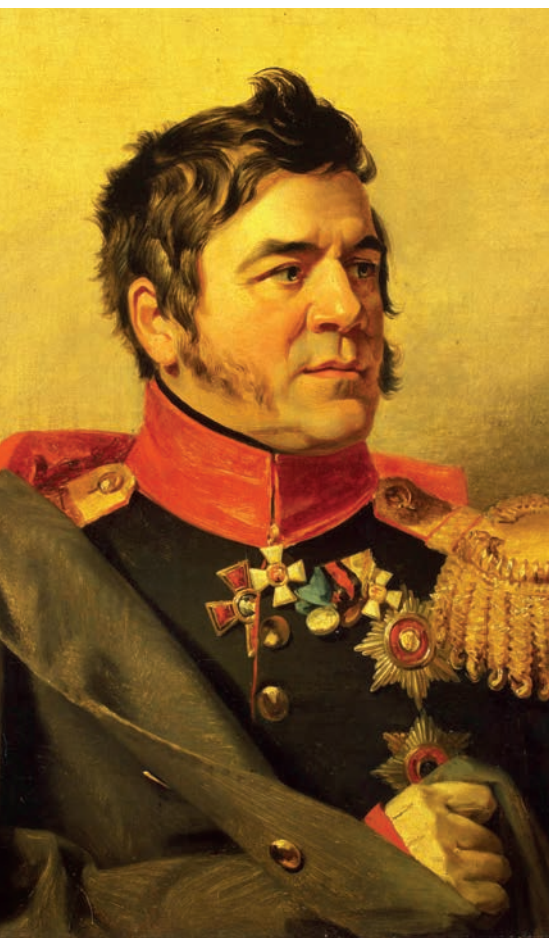
Generalowie Iwan Szachowski i Fabian Osten-Sacken, których dywizje stacjonowały w Nieporęcie

Po dwóch tygodniach od wkroczenia interwencyjnego korpusu feldmarszałka Iwana Dybicza do Królestwa Polskiego, wojska rosyjskie zbliżały się do Warszawy. 22 lutego 1831 r. Rosjanie byli już w Pułtusk i stało się jasne, że przez Serock i Nieporęt kierują się do stolicy. Dowództwo polskie postanowiło przerwać ten pochód na moście na Narwi łączącym Zagroby (dziś Zegrze Płd.) z Zegrzem. Nieoczekiwanie okazało się, że starcie z Rosjanami nastąpiło nie tam, a pod Nieporętem.