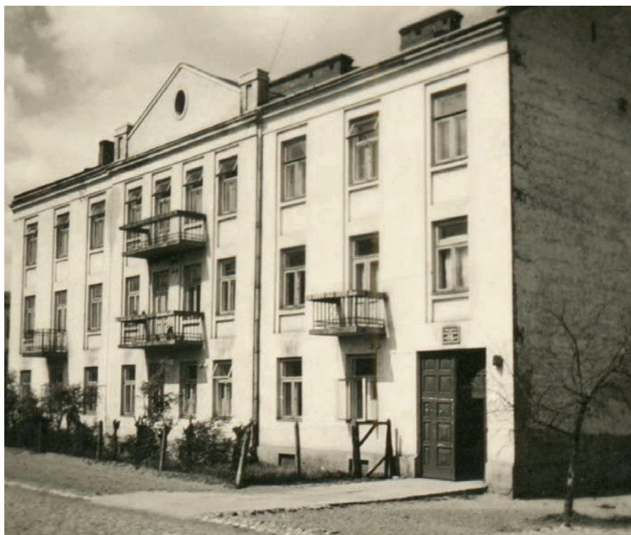
Budynek Gminnej Szkoły Handlowej w Legionowie w czasie okupacji (MHwL/Zd1969)

no na legionowskim cmentarzu (w kwaterze wojennej).