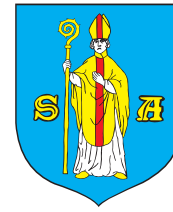
Miasto i Gmina Serock