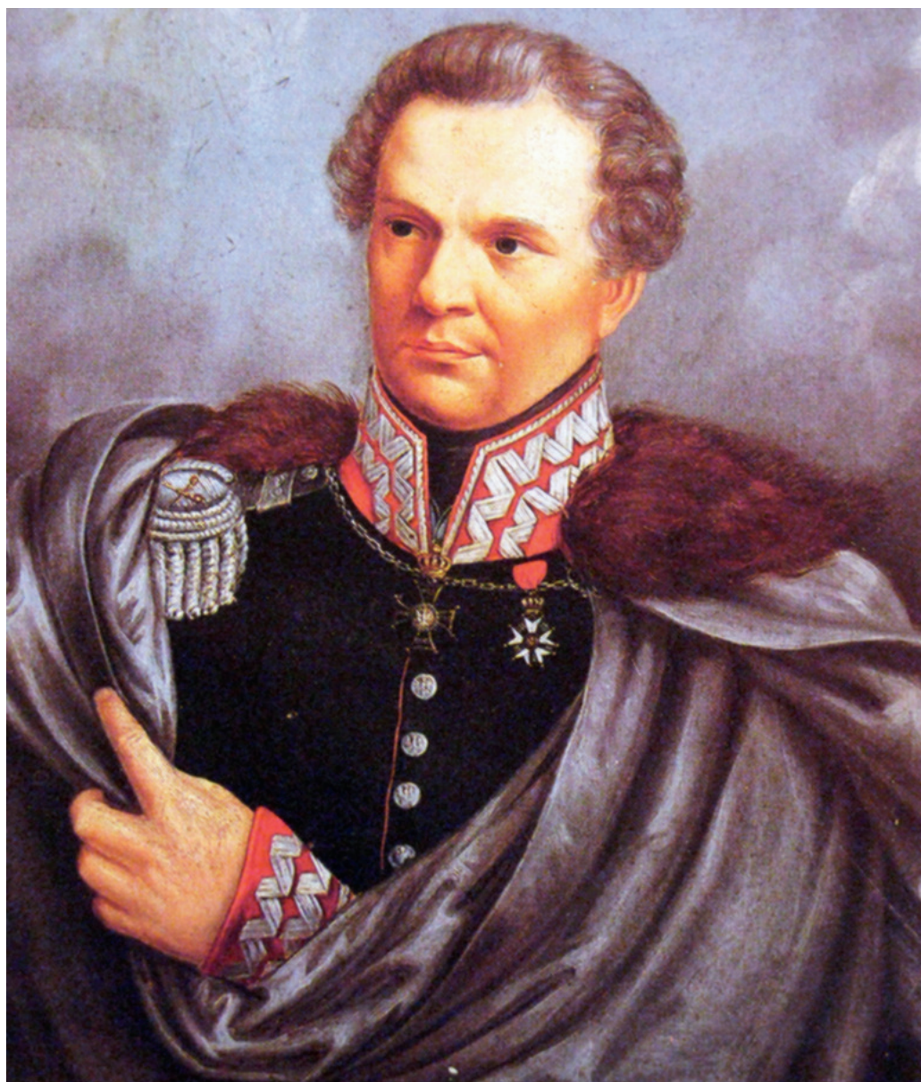
Gen. Jan Skrzynecki - dyktator powstania, głównodowodzący w majowej wyprawie na Rosjan

16 maja 1831 r. cała armia polska znajdowała się na linii Pułtusk-Wyszków-Nur. Trzy dni później pojawia się pierwsza okazja do zaatakowania gwardii ale tego zaniechano, co okazało się błędem i umożliwiło Dybiczowi wycofanie swoich sił. Skrzynecki, który dotarł niepotrzebnie aż do Tykocina,