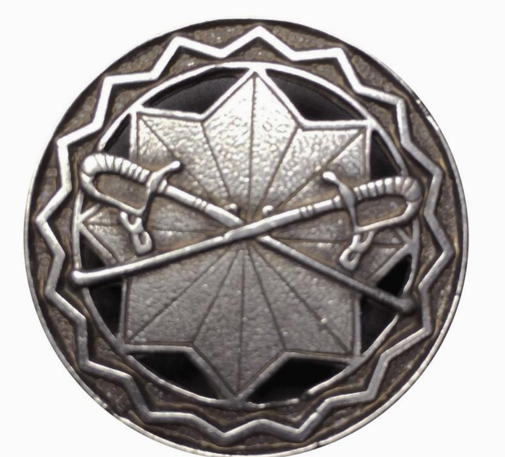
Znak oficerski tzw. „Parasol” - odznaka nadawana przez J. Piłsudskiego słuchaczom Szkoły Oficerskiej ZWC