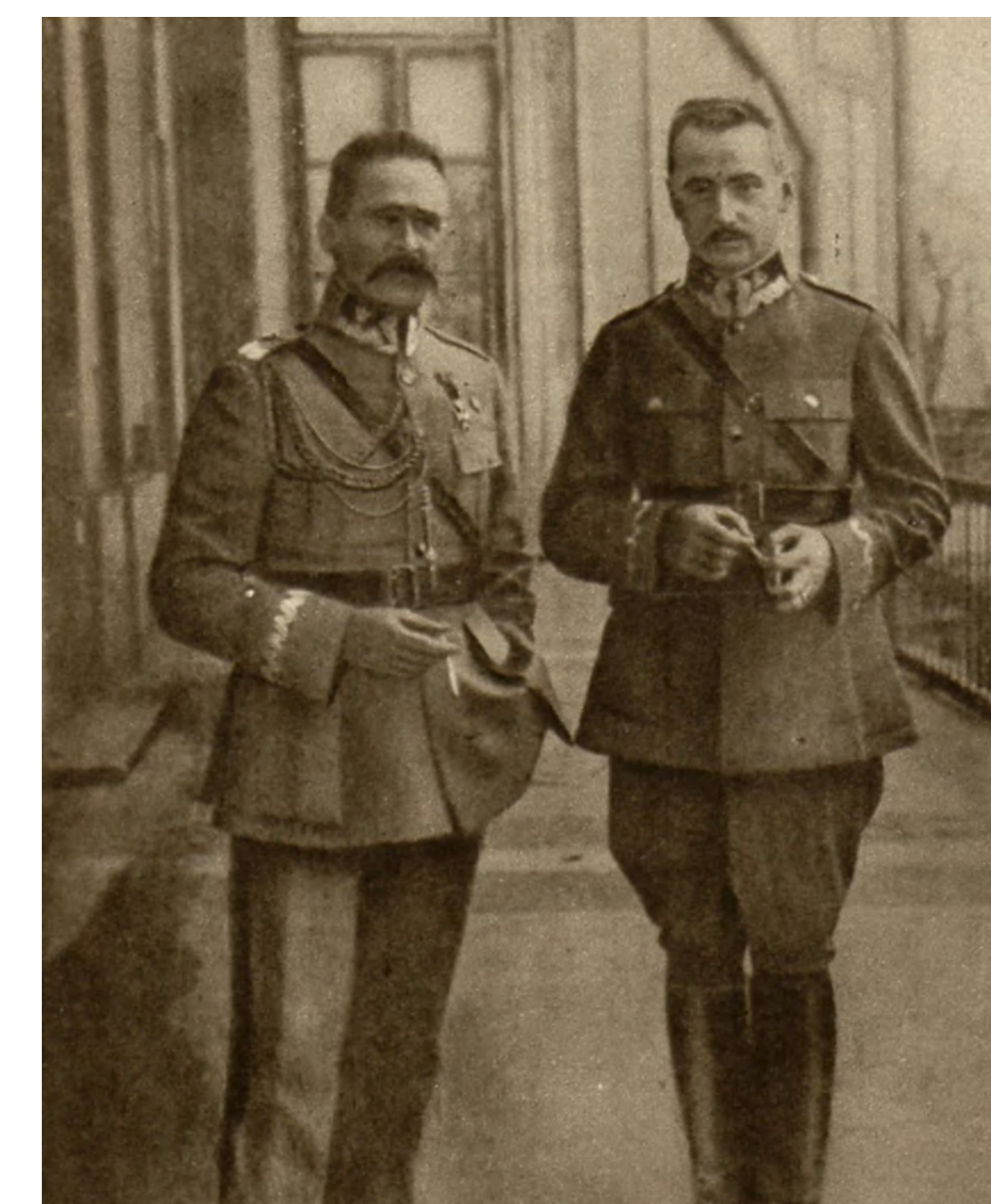
Józef Piłsudski i Kazimierz Sosnkowski

W 1910 roku powstały podległe ZWC organizacje jawne: Związek Strzelecki we Lwowie i Strzelec w Krakowie, będące faktycznie organizacjami przysposobienia wojskowego. W 1914 r. ZWC liczył 7239 członków, stanowiąc kadry tworzonych Legionów Polskich. Równocześnie powstawały organizacje paramilitarne związane z orientacją polityczną zbliżoną do endecji: Polskie Drużyny Strzeleckie i Drużyny Bartoszewskie.