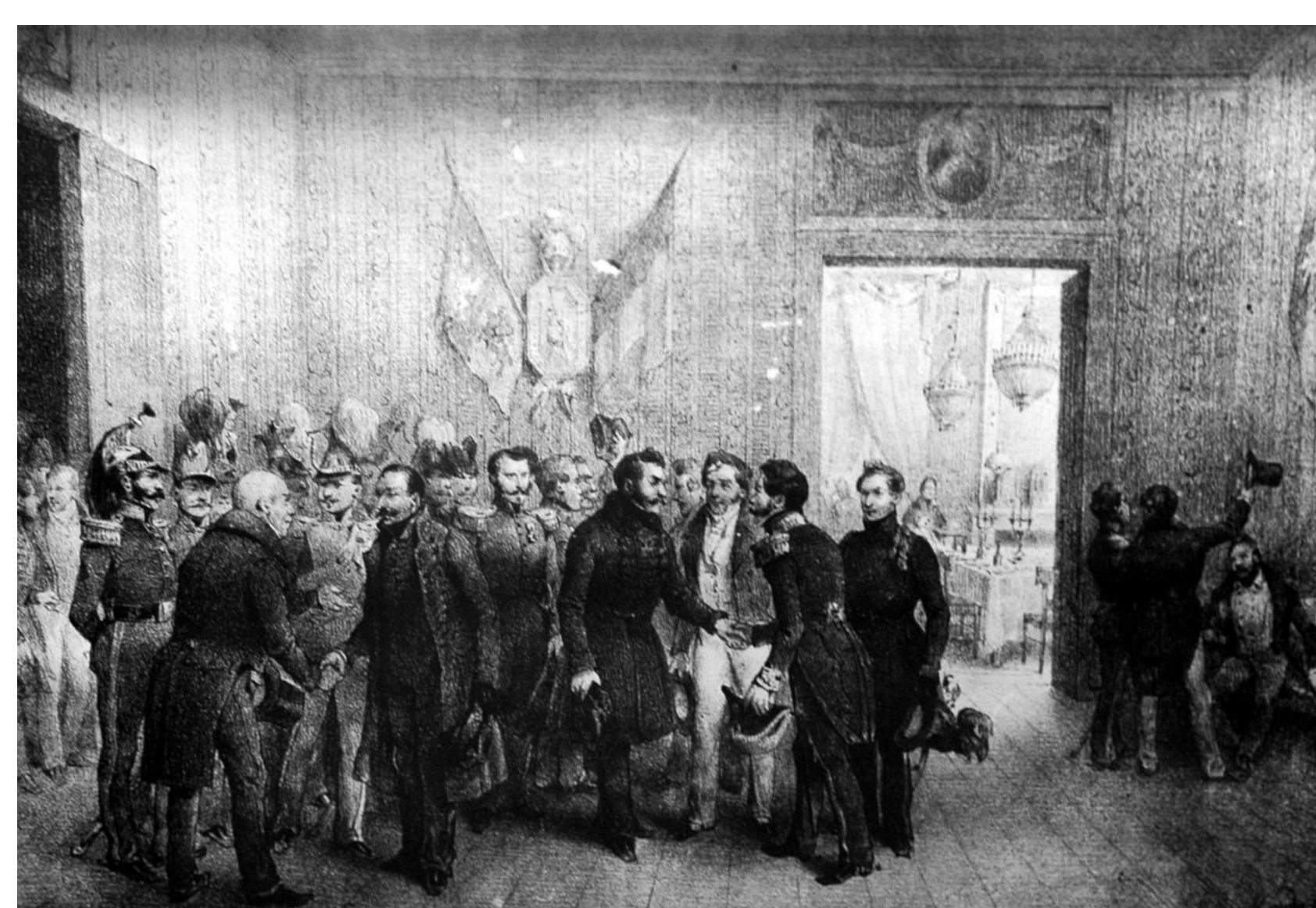
XIX-wieczna grafika przedstawiająca scenę powitania polskich emigrantów w Belgii

Na emigracji powstało wiele ugrupowań politycznych - zarówno lewicowych, jak i prawicowych, których wspólnym marzeniem i celem było odzyskanie przez Polskę niepodległości. Wizji przyszłości Polski było tyle, ile programów politycznych. Konserwatyści uważali, że skłonienie któregoś z mocarstw do poparcia sprawy polskiej jest jedyną szansą na pokonanie znacznie silniejszego wroga. Z kolei demokraci- dalszą walkę o niepodległość wiązali z koniecznością przeprowadzenia gruntownych reform społecznych i politycznych. Konserwatystów skupiał książę Adam Czartoryski, najbardziej umiarkowani demokraci związani byli z Joachimem Lelewelem, bardziej radykalni z Towarzystwem Demokratycznym Polskim, a skrajna lewica z Gromadami Ludu Polskiego.