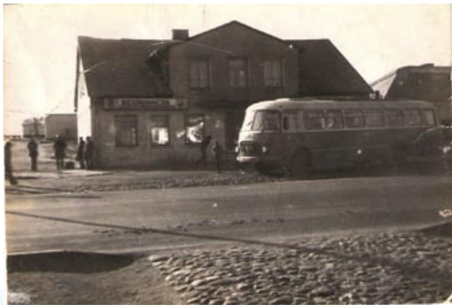
Restauracja Kormoran oraz autobus PKS - lata 70-te XX w.

W budynku znajdującym się za restauracją w pierwszych latach po II wojnie światowej znajdowała się kuchnia, wydająca darmowe obiady dla dzieci i podopiecznych pomocy społecznej, zorganizowana przez władze miasta.