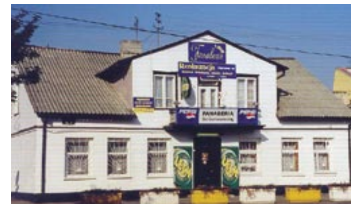
Restauracja Fanaberia 1999 r.