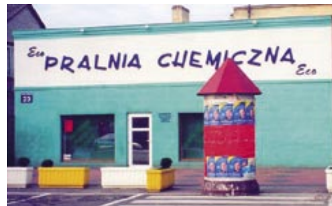
Pralnia chemiczna 1998 r.