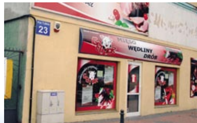
Sklep mięsny dzisiaj