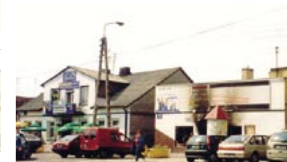
Ostatni etap działalności restauracji i koniec sklepu Adama Gołębiowskiego

sce sklepu mięsnego pod szyldem GS-u powstał duży sklep spożywczy, w którym pracowały żona i najstarsza córka Józefa Obrębskiego. Z tego względu ten popularny sklep był nazywany dalej przez wszystkich sklepem „U Obrębskich”. Z wyjątkiem krótkich przerw, na funkcjonowanie sklepu chemicznego oraz pralni chemicznej, przez ponad 60 lat działają w tym miejscu sklepy ogólnospożywcze lub mięsne.