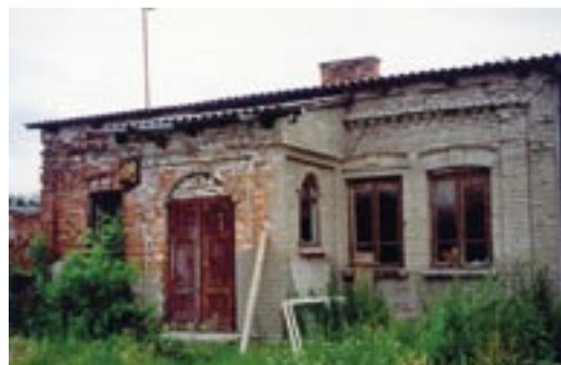
Budynek na tyłach restauracji - w pierwszych latach po II wojnie światowej miejsce wydawania bezpłatnych obiadów

Budynek dawnej gospody, działającej w okresie PRL-u najpierw pod nazwą „Gospoda Ludowa”, potem bardzo długo jako „Restauracja Kormoran”, w ostatniej odsłonie jako „Restauracja Fanaberia”, został niedawno sprzedany przez Gminną Spółdzielnię Bankowi Spółdzielczemu w Wyszkowie, a ten odsprzedał go osobie prywatnej. Już w okresie II Rzeczypospolitej działała tu restauracja pani