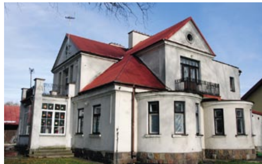
Ośrodek TPD - widok od strony wsch.-płd.