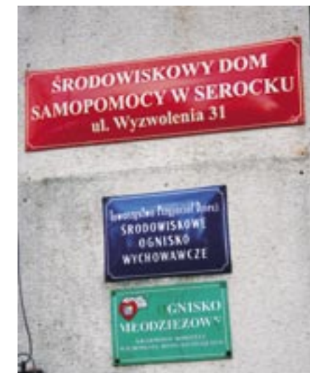
Tablice z nazwami działających w Ośrodku instytucji.