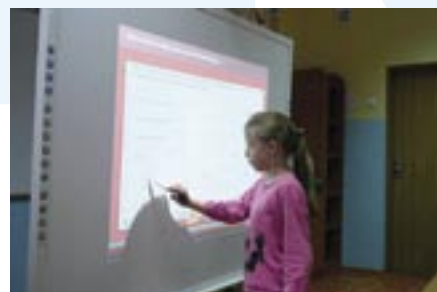
Lekcja z Multibookiem w Zespole Szkół w Zegrzu

Szkoły i przedszkola – przystosowują swoją ofertę do potrzeb uczniów i rodziców w sposobie i tempie uczenia; wspomagają oraz rozwijają indywidualne możliwości ucznia, wdrażają w edukacji technologie informacyjno – komunikacyjne.