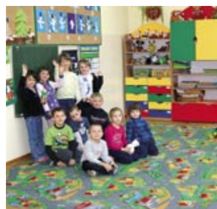
Oddział przedszkolny w Szkole Podstawowej w Serocku

Nowe placówki przedszkolne będą rozszerzały ofertę przedszkolną w gminie, co daje rodzicom większy wybór placówki dla swojego dziecka, natomiast przedszkola będą wkładać dużo wysiłku i pracy, aby zyskać zaufanie i uznanie rodziców.