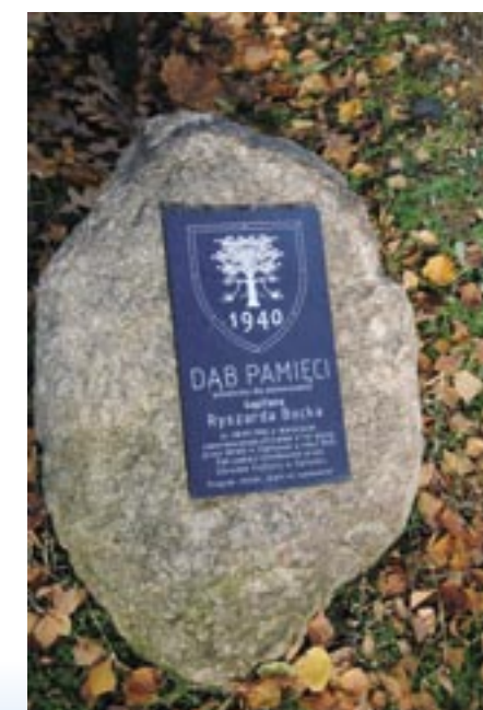
Kamień przy dębie pamięci