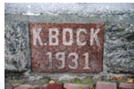
Kamień wmurowany w zach. ścianę budynku