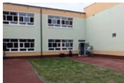
Dobudowana część Zespołu Szkolno-Przedszkolnego w Woli Kiełpińskiej

Prowadzono inwestycje polepszające warunki nauczania