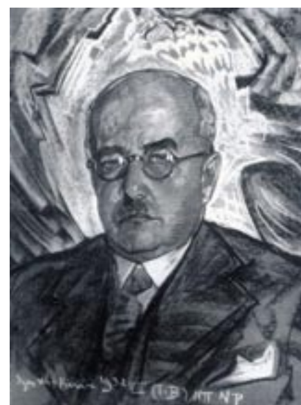
Portret ministra Stefana Hubickiego namalowany przez Witkacego.