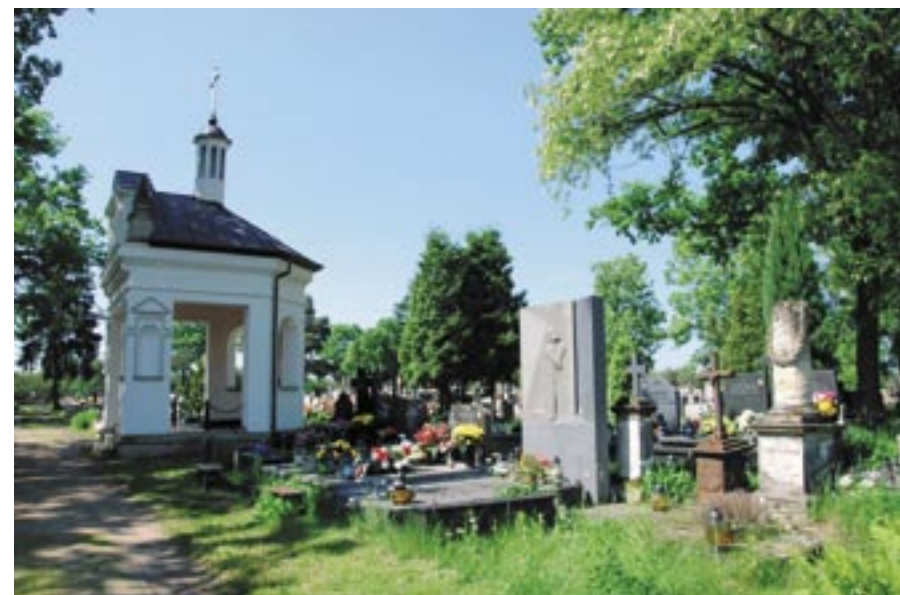
Kaplica z sąsiadującymi grobami m.in. Sutkowskich