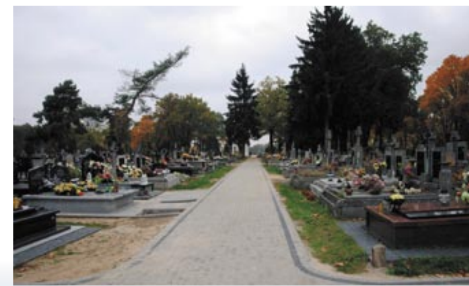
Główna aleja od strony zachodniej