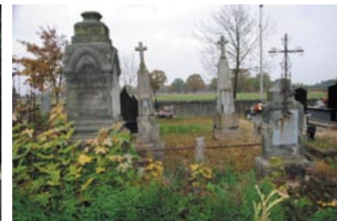
Część cmentarza z nagrobkami z początku XX w.