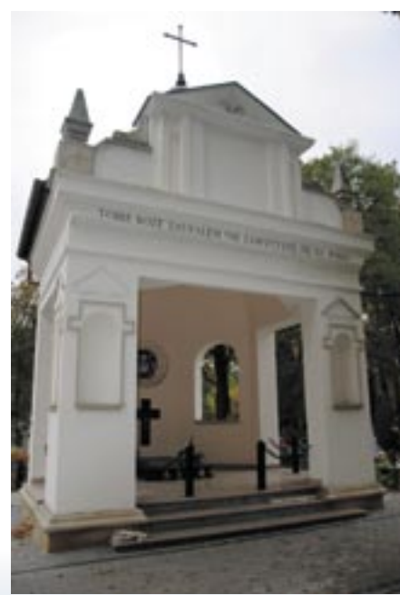
Kaplica im. bł. ks. Romana Archutowskiego