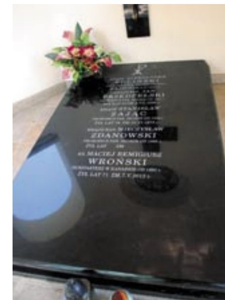
Płyta wewnątrz kaplicy z nazwiskami księży