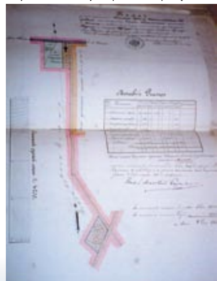
Cmentarz na planie z 1893 r.

O ile dla większości wiejskich rodzin przeniesienie cmentarza nie stanowiło problemu, bowiem na ich ziemnych grobach były najczęściej tylko drewniane krzyże, których trwałość raczej nie przekraczała pamięci dwóch