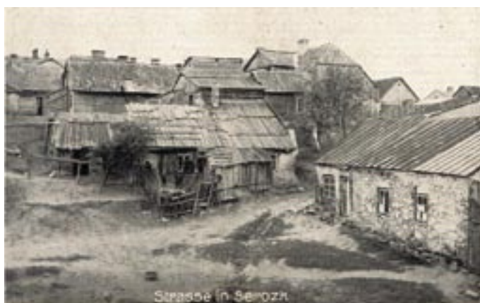
Pocztówka z obiegu maj 1917 r.