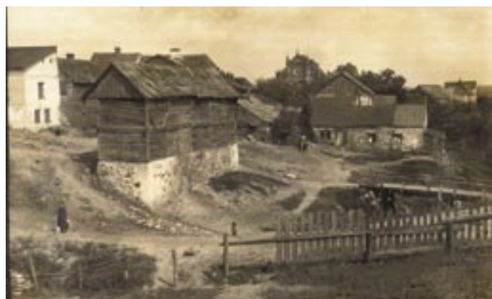
Nowoodkryta pocztówka z ok. 1916 r.