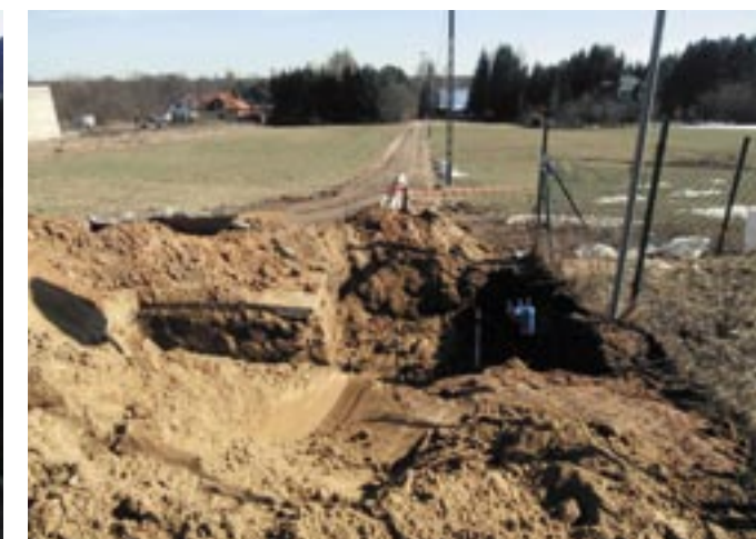
Przebudowa wodociągu azbestocementowego w Wierzbicy