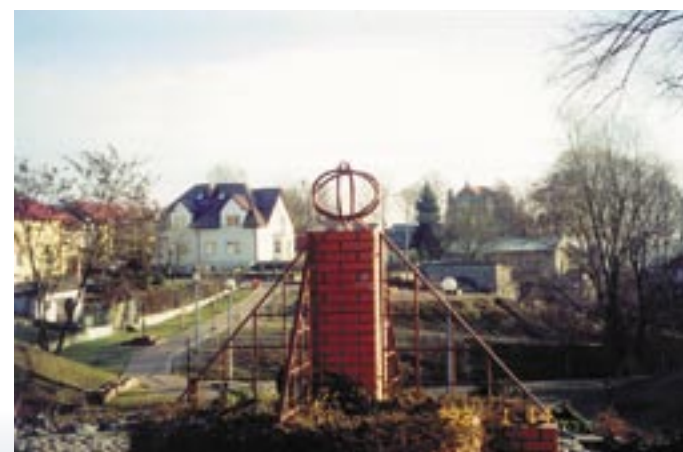
Elementy małej architektury