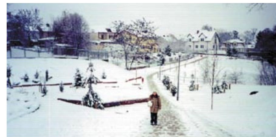
Schody i chodnik od ul. Radzywińskiej do Św. Wojciecha