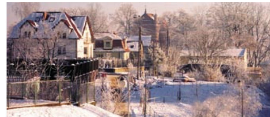
Widok na skrzyżowanie Traktu spacerowego z ulicami Poniatowskiego i Św. Wojciecha