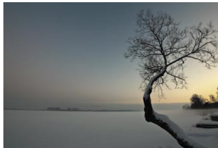
I miejsce – „Idzie mgła”

26 lutego 2013 roku w Urzędzie Miasta i Gminy w Serocku został rozstrzygnięty konkurs fotograficzny „Jezioro Żegrzyńskie w zimowym obiektywie”. Zimowe krajobrazy Jeziora Żegrzyńskiego, samotne ławeczki oczekujące odpoczynku spacerowiczów, kryształki lodu odbijające promienie zachodzącego słońca – trzydzieści prac – malowniczych, tajemniczych, emocjonujących. Komisja konkursowa miała niełatwe zadanie.