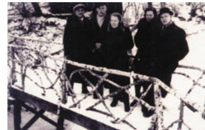
Młodzi serocczanie na mostku w czasach II wojny światowej