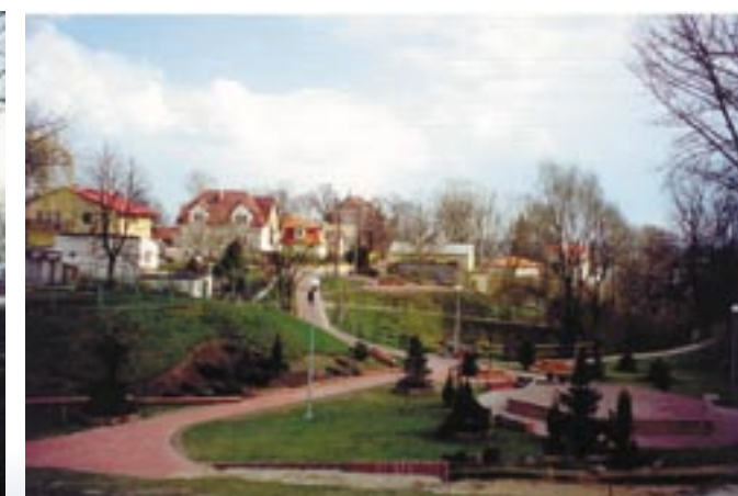
Trakt spacerowy wiosną 2002 r.