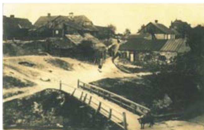
Pocztówka niemiecka z 1915 r.

Walory położenia Serocka na wysokiej nadnarwiańskiej skarpie są dobrze znane. Skarpa ta jest pozostałością wyżyny lodowcowej, a konkretnie są to wzgórza moreny czołowej. Przecinają je wąwozy wyżłobione przez mniejsze i większe strumyki, dziś już najczęściej zanikłe, jedynie okresowo odprowadzające wody opadowe i roztopowe. Najbardziej znanym jest ten oddzielający grodzisko od wzgórza z plebanią.