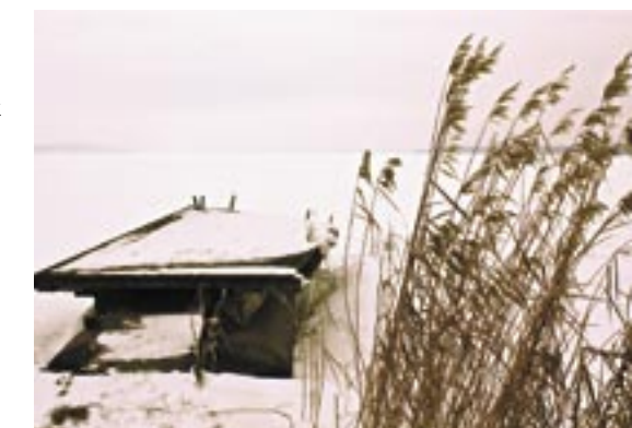
III miejsce – „Zimowy spokój”