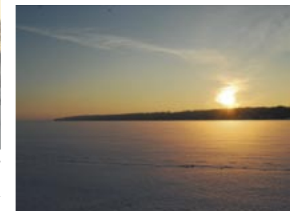
II miejsce – „Lśnienie jeziora”

Za udział w konkursie serdecznie dziękujemy wszystkim uczestnikom, zwycięzcom – gratulujemy.