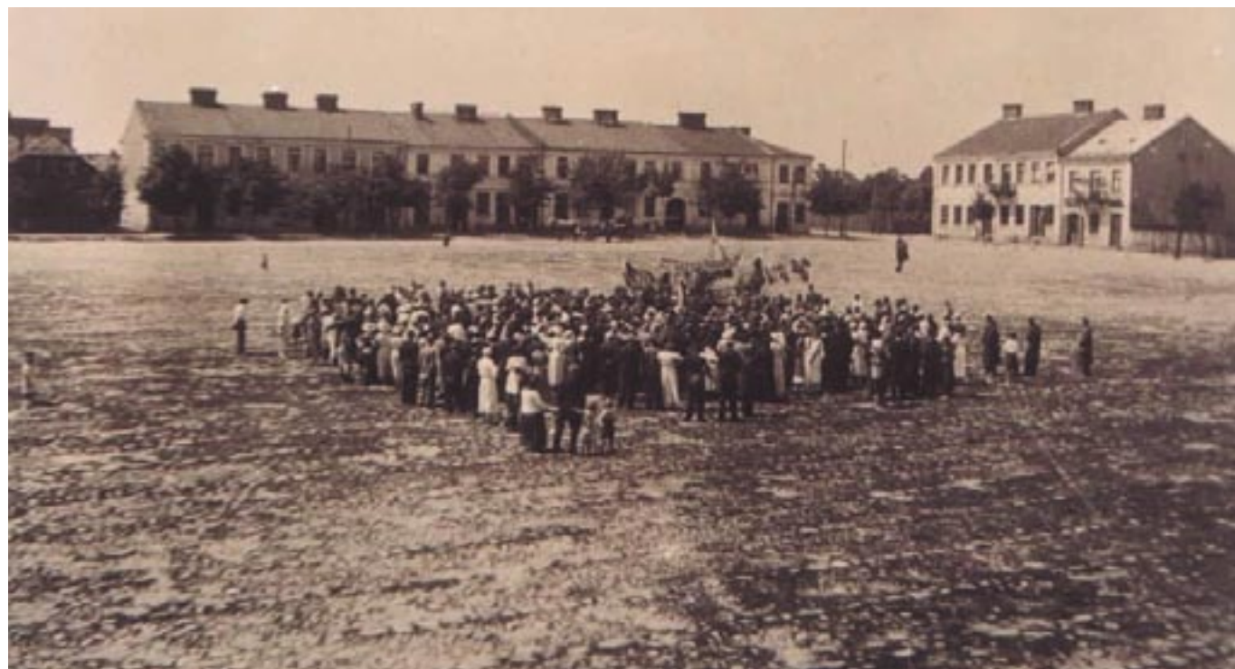
Manifestacja na rynku

75. rocznica wybuchu II wojny światowej uświadomiła nam, że żyją teraz już bardzo nieliczni świadkowie pamiętnego września 1939 r., którzy wówczas byli dziećmi. O wydarzeniach poprzedzających wojnę też wiemy niewiele.