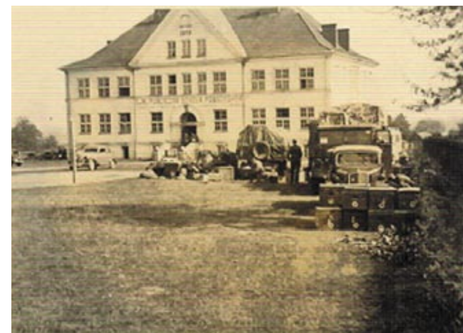
Niemiecy żołnierze przed szkołą w Serocku