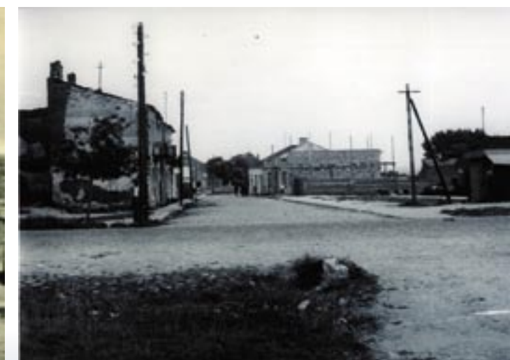
Skrzyżowanie ul. Kościuszki i 3 Maja