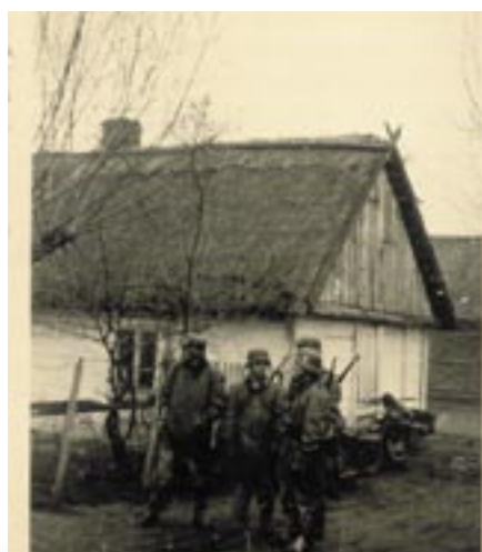
Niemiecy motocykliści przy jednym z gospodarstw w zachodniej części Serocka

Serock znajdował się dość daleko od granicy z Niemcami, ale w rejonie głównych punktów oporu jakimi były Warszawa i Modlin, dlatego jego mieszkańcy doświadczyli okrucieństw wojny już 5 września. Około południa niemieckie samoloty dokonały nalotu na mia-