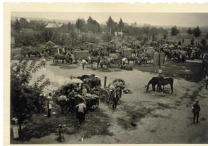
Obóz niemieckiej kolumny sanitarnej przed wkroczeniem do Serocka