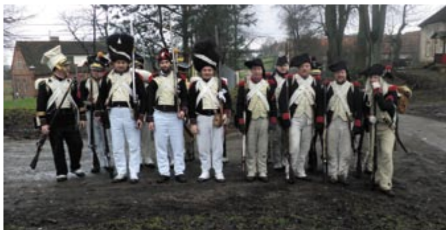
Wojska piechoty składały się z trzech formacji: grenadierów, woltyzierów i fizylierów. Grenadierzy, to ciężka piechota, dlatego wybierano mężczyzn potężnie zbudowanych. Mieli za zadanie wykonać główne uderzenie. Woltyzierowie - szczuplejsi, drobniejsi, biegali, ostaniiali skrzydła. Fizylierzy z kolei to taka typowa piechota liniowa, nacierali kolumnie i prowadzili walkę ogniową. Warunek jaki musiał spełniać żołnierz piechoty, to zdrowe zęby, bo musieli ładunek oderwać zębami, by wyspać proch do lufy.

się czarnego prochu, który generalnie stwarza tylko efekty wizualne, nie strzela się do siebie naprawdę. Jednak nawet jak się poczuje ciężar uzbrojenia, zmęczy kilkunastokilometrowym marszem w różnym terenie, w zmiennych warunkach atmosferycznych, jak się stanie do walki w ponad trzydziestostopniowym upale, to potem trudno wrócić do rzeczywistości, w której media podają kolejne liczby ofiar w jakiejś wojnie.