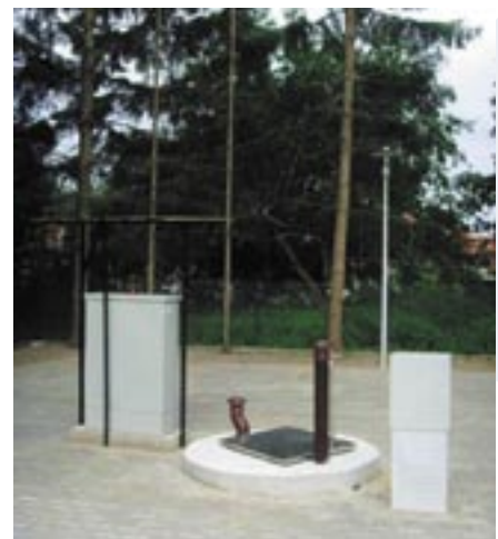
Przepompownia ścieków przy ulicy Okrężnej w Jadwisinie

Wybudowano 670,7 mb sieci kanalizacji grawitacyjnej i 226 mb kanału tłoczego oraz przepompowni ścieków. Do nowo wybudowanej sieci zostały podłączone 26 posesji.