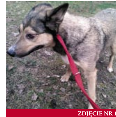
ZDJĘCIE NR 1

Zdjęcie nr 2 – Pies Bak. Odłowiony w dniu 7 kwietnia 2014 r. w Izbicy na ulicy Wiejskiej. Ma ok. 4 lata, jest nieduży.