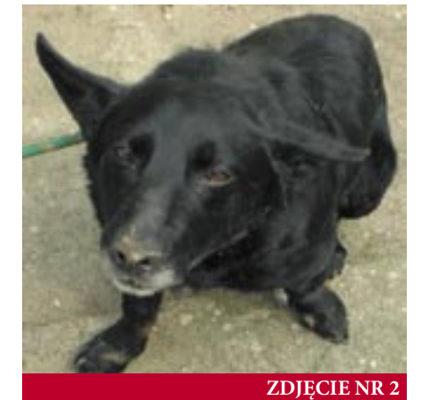
ZDJĘCIE NR 2

Osoby zainteresowane prosimy o kontakt z Referatem Ochrony Środowiska, Rolnictwa i Leśnictwa, (tel: 22 782 88 39 i 22 782 88 40), Strażą Miejską w Serocku (tel 22 782 88 33,