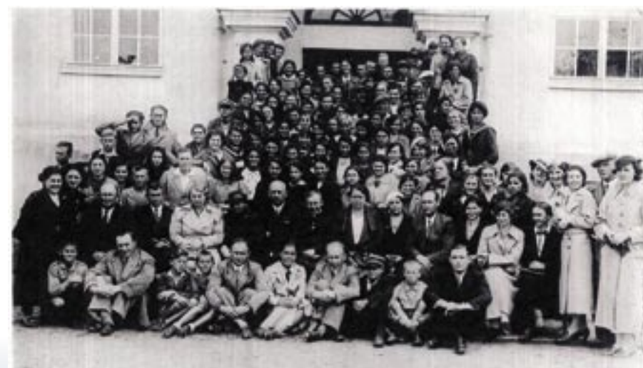
Zdjęcie szkolne 1938 r.