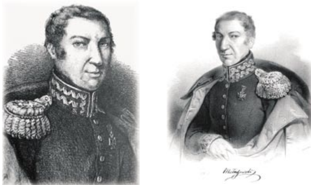
gen. Kazimierz Małachowski

Benigna z Wojszyków Małachowska (1795-1873), jako żona słynnego generała Kazimierza Małachowskiego (1765-1845), w pewnym momencie zastępcy naczelnego wodza powstania listopadowego, była jedną z najważniejszych kobiet życia publicznego tego czasu. Stawiana jest obok takich postaci jak Klementyna z Tańskich Hoffmanowa, Klaudyna z Działyńskich Potocka, czy Emilia Szczaniecka, których działalność nie ograniczała się do pomocy rannym w lazaretach czy zbierania kosztowności i pieniędzy na potrzeby wojska, ale miała wpływ na wzmacnianie uczuć patriotycznych na ulicach Warszawy, sali sejmowej oraz w szeregach wojska.