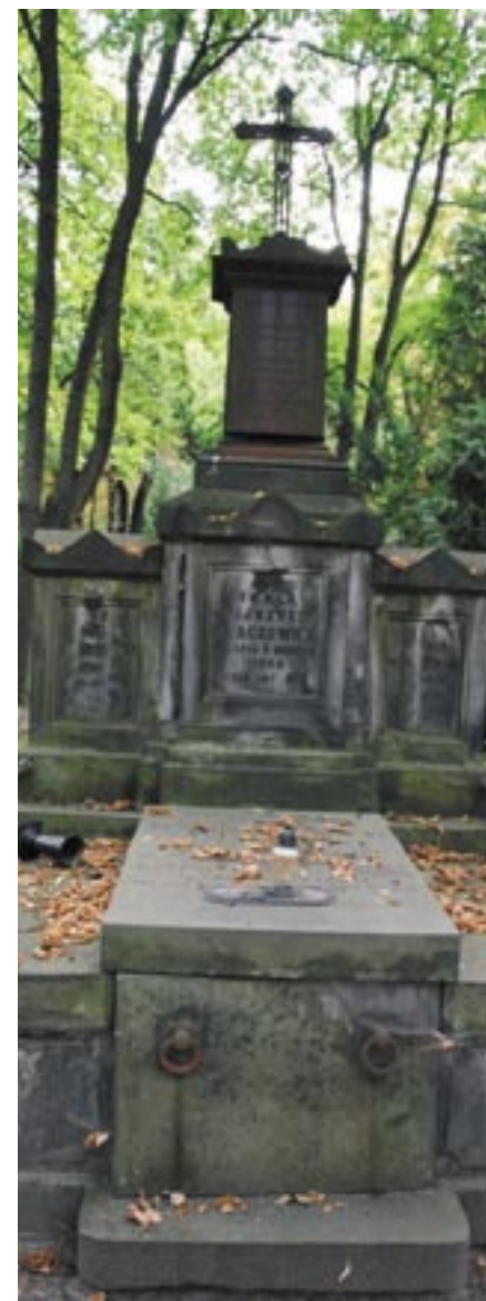
Grób rodziny Marczewskich