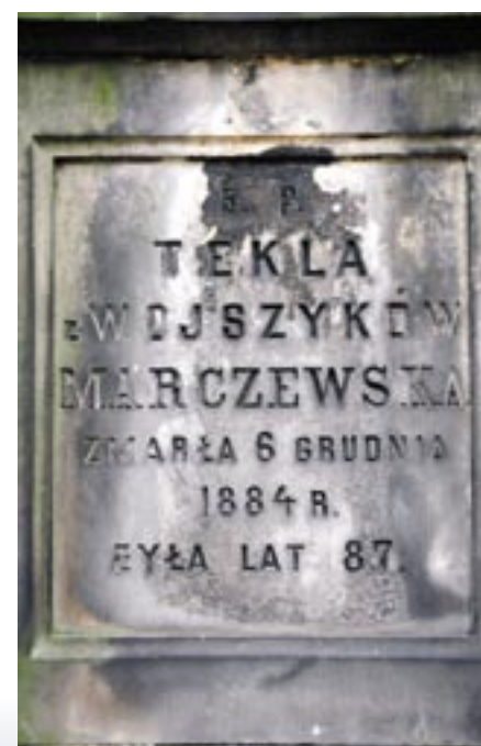
Płyta z inskrypcją Tekli z Wojszyków