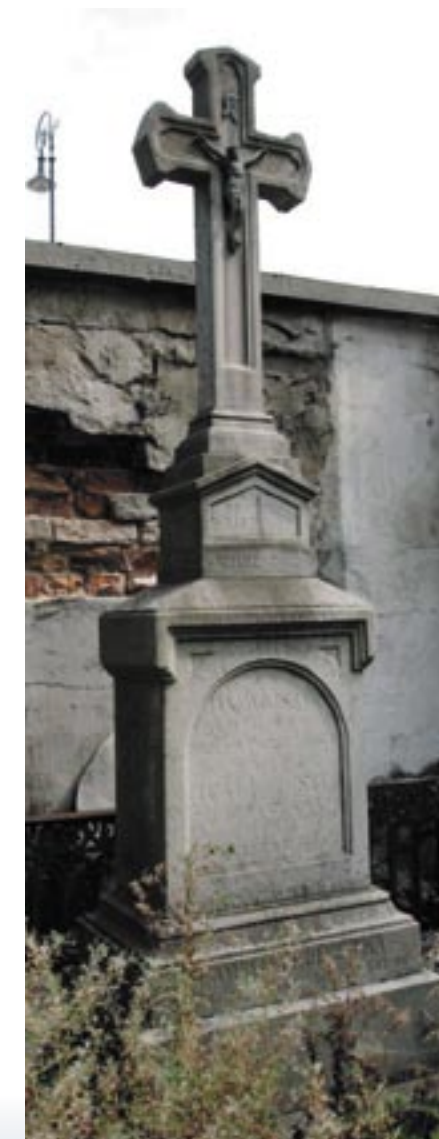
Grób Wojszyków i Kulczyckich