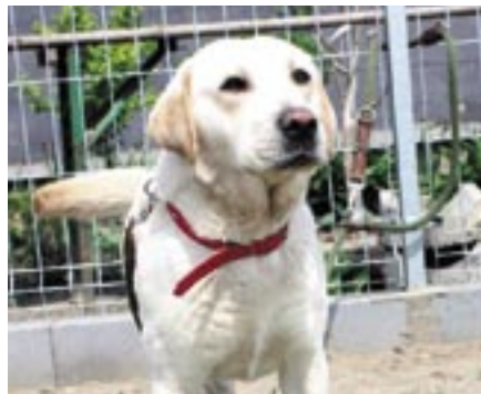
Pies Król ma ok. 3 – 4 lat. Trafila do schroniska 8 maja 2015 r. z miejscowości Stanisławowo.

Osoby zainteresowane prosimy o kontakt z Referatem Ochrony Środowiska, Rolnictwa i Leśnictwa, (tel: 22 782 88 39 i 22 782 88 40), Strażą Miejską w Serocku (tel 22 782 88 33, 603 873 290) lub bezpośrednio ze Schroniskiem ( www.fundacjap-som.pl )