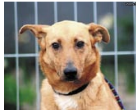
Suczka Greta ma ok. 1,5 roku. Trafila do schroniska 3 maja 2015 r. z miejscowości Dębe.