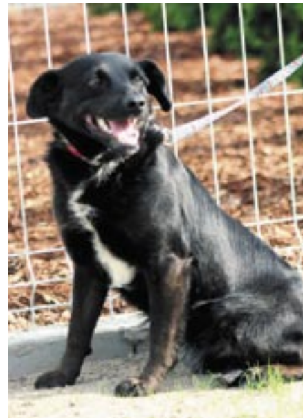
Pies Smerfik ma ok. 3 lat. Trafila do schroniska 8 maja 2015 roku z Zabłocia.