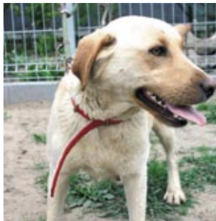
Suczka Dama ma ok. 3 – 4 lat. Trafila do schroniska 8 maja 2015 r. z miejscowości Stanisławowo.

Ponieważ żaden z przekazanych do schroniska psów, nie miał obroży, ani nie był zaczipowany, nie udało się ustalić ich właścicieli. Dlatego zamieszczamy zdjęcia, wraz z krótkim opisem – być może rozpoznają Państwo wśród nich swoje zagubione zwierzęta, a może po prostu będziecie Państwo zainteresowani ich adopcją.