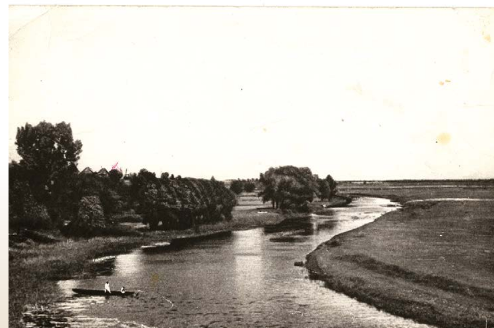
Narew w Serocku 1963 r. widok na rzekę przed utworzeniem Zalewu Zegrzyńskiego