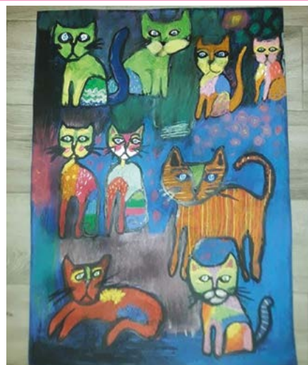
praca Darii Tańskiej