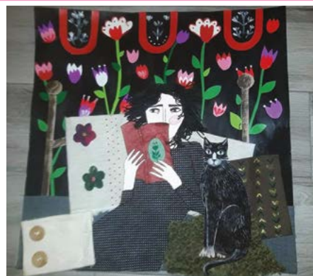
praca Damiana Sosnowskiego

W dniu 19 maja rozstrzygnięto VII Międzynarodowy Konkurs Plastyczny „Przyroda w Kolorach” – ŚWIAT WIELKICH I MA-