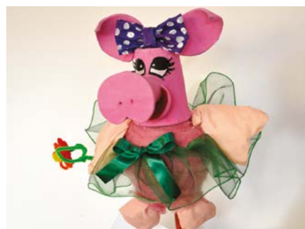
praca Barbary Kraus