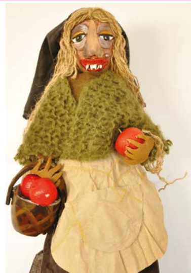
praca Patrycji Nowak