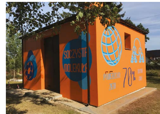
Wcześniejszy stan i wygląd budynku SUW Dębinki.

O tym wszystkim oraz o tym iż zasoby wody na ziemi nie są niewyczerpalne pamiętajmy mając codzienny kontakt z molekułą wody; molekułą ze wszech miar godną określenia soczysta.