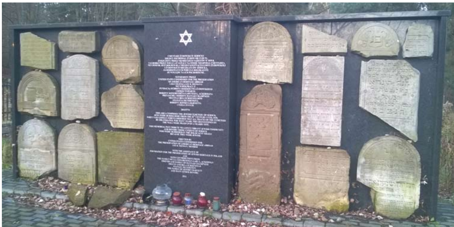
Lapidarium odsłonięte w 2014 r. na serockim cmentarzu

zamordowana. Część ocalałych z holokaustu osiedliła się po wojnie w Łodzi, Dzierżonowie i Szczecinie, a część wyemigrowała, m.in. do Stanów Zjednoczonych, Izraela i Argentyny.