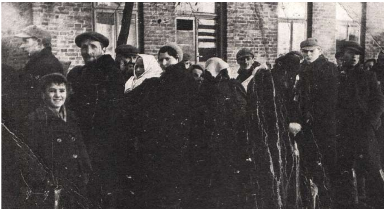
Grupa Żydów przed wypędzeniem z Serocka, 5 grudnia 1939 r. (S. Gutkowski, Niezatarcie historie. Księga o Serocku, Putusk-Serock 2016, s. 201)