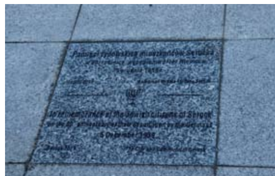
Odsłonięcie tablicy pamiątkowej w 80. rocznicę wypędzenia żydowskich mieszkańców Serocka